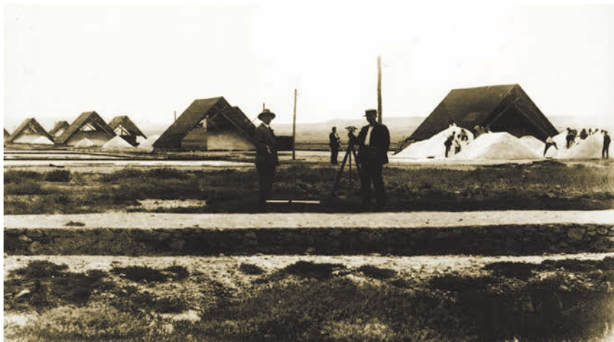
Proizvodnja soli na Pagu na staroj fotografiji

raditi bilo kakve usporedbe, ali treba reći da je 1409., dakle u vrijeme dok se zid još gradio, Ladislav Napuljski prodao Mlečanima Dalmaciju za 100.000 dukata. Vjerojatno je dakle zahvat u blizini Stonske prevlake stajao više od cijele Dalmacije. Da se sve to Dubrovčanima isplatilo, uopće ne treba sumnjati jer su to dokazali cjelokupnim svojim postojanjem. Postoji podatak da su 1575., za druge godine nema podataka, u Stonu samo od soli uprihodili 15.900 dukata, a ostali su prihodi (meso, riba, vino i sl.) iznosili tek 1830 dukata. Ako je tako barem približno bilo svake godine, onda uopće ne čude razmjeri toga golemog projekta.