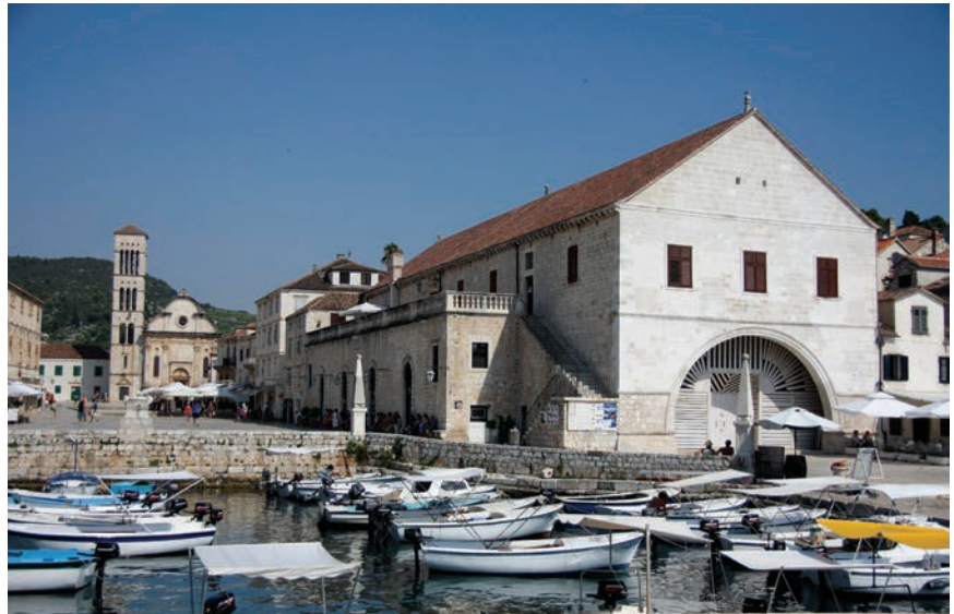
Arsenal na Hvaru danas je komunalno kazalište

S gradnjom brodova na moru usko je povezan pojam arsenal (dolazi od arapskog izraza dar-as-sinh u doslovnom značenju tvornička kuća), što je zapravo skup radionica i skladišta za izradu, popravak i čuvanje oružja, streljiva i ratne opreme,