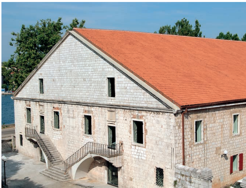
Zgrada arsenala u Zadru

Prvi arsenal u Hvaru su izgradili Mlečani početkom 14. st. Godine 1430. počeo se graditi novi i potpuno je dovršen 1559., ali su ga Turci razorili, opljačkali i zapalili zajedno s gradom Hvarom. Treći je izgrađen 1612. U njega je mogla stati cijela galija i uz neke se nadogradnje sačuvao i danas, a u njemu je uređeno komunalno kazalište. U Korčuli je izgrađen arsenal kod tvrđavskog revelina i u njemu su Mlečani potkraj 18. st. gradili fregate i s 40 topova. Kako je Korčula zbog dobrih šuma postala jadransko brodogradilišno središte, Mlečani su u nju 1776. preselili hvarski arsenal.