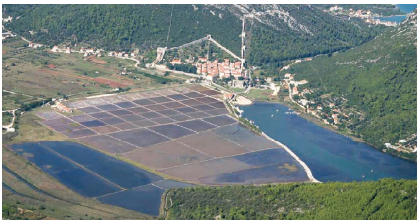
Solana i Ston snimljeni s morske obale

Čim su se domogli priželjkivanog poluotoka, odmah su obnovili zapuštena solila i počeli razmišljati o kanalu preko 1450 m