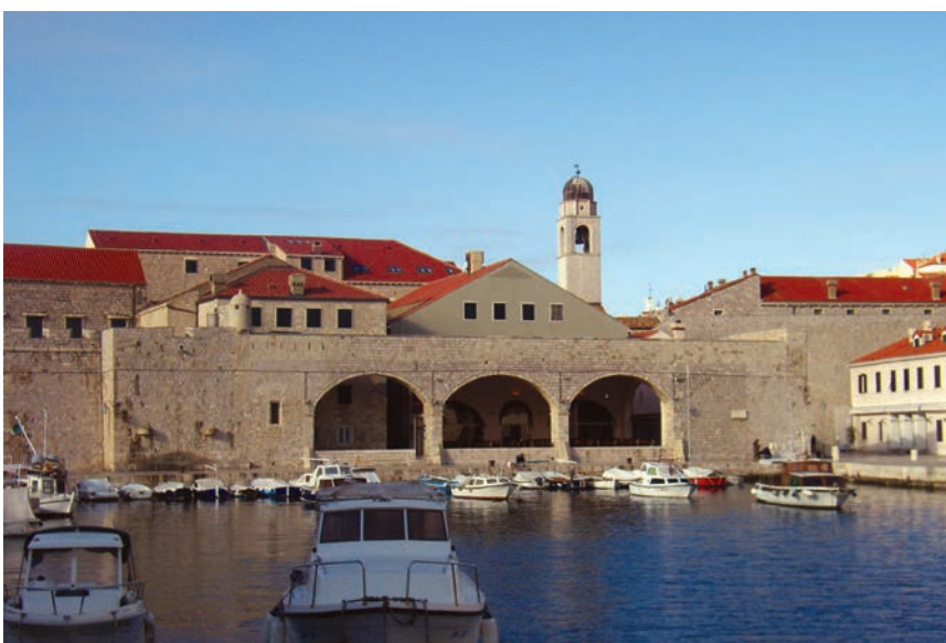
Arsenal u Dubrovniku danas je gradska kavana

vlakama ili uz obalu, a takvi su se arsenali nalazili u svim većim lukama, pa tako i u Pireju, Korintu, Solunu, na Rodu, Samosu i dr. Najpoznatiji je bio atenski u Pireju koji je u Periklovo doba mogao primiti i do 400 brodova. Rimski su arsenali znatno zaostajali za grčkima jer su po Tiberu mogli do Rima ploviti samo manji brodovi, a Rimljani u početku nisu ni imali stalnu ratnu flotu već su po potrebi popravljali stare zarobljene brodove. Poslije su ipak izgradili arsenale u Ostiji, Pozzuoli pokraj Napulja i u Miseni na Tirenskom moru. U 1. st. proširena je Ostija i izgrađeno skladište.