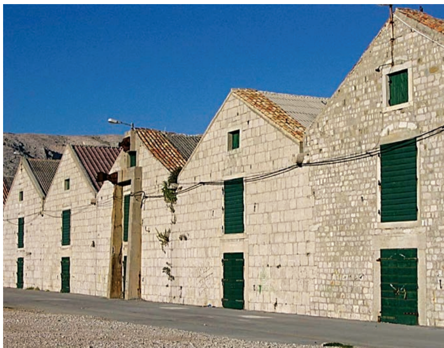
Stari magazini za skladištenje soli

ski kompleks kao najveći i najskuplji srednjovjekovni zahvat industrijske baštine? U kompleksu bi bila uključena proizvodnja soli, izvozna luka, i stambene zgrade za radnike solane i luke, a sve se to nije mijenjalo, ili nije bitno, od vremena otkad je izgrađeno. Umjesto što se nepotrebno iscrpljujemo nevažnim detaljima o starosti proizvodnje soli ili najdužim europskim zidinama, ne uočavamo da prepuštamo istaknuti da imamo najveći fortifikacijsko-urbanistički zahvat iz 14. st. u ondašnjoj Europi koji je u cijelosti bio izgrađen u funkciji proizvodnje.