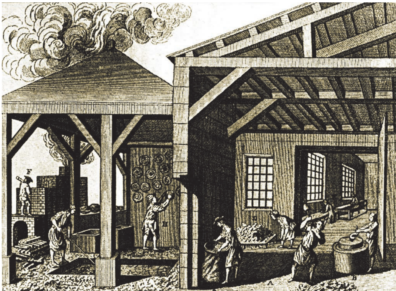
Crtež jedne stare manufakture

joj produktivnosti koja je bila znatno veća nego i ondašnjem austrijskom carstvu. Inače je najstarija manufaktura vunenog tekstila osnovana krajem 18. st. u Turnju kod Karlovca i dugo je poslovala. Imala je 12 tkalačkih stanova i 138 zaposlenih, a od toga u predionici i 40 žena kažnjenica. Prestala je s radom 1847., ali je poslije opet obnovljena.