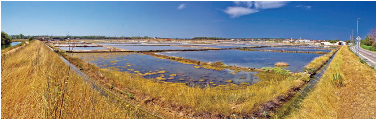
Solana u Ninu

Danas ima ukupno devet skladišta soli i nalaze se na Prosimi nasuprot gradskoj jezgri Paga i građena su u 17. i 19. st. kada su stara mletačka skladišta temeljito preuređena i izgrađena nova. Danas su skladišta zaštićeni spomenici industrijske arhitekture i svjedok utilitarnog graditeljstva, a u prvom, koji je nosio ime Ferdinand, uređena je i stalna izložba solarstva. Inače su se skladišta, koja se nazivaju magazini, nosili nazive Frane Karlo, Frane Josip, sv. Marko, sv. Petar, Ivan Kristitelj, Ludovik i Ferdinand Maksimilijan, a od 1946. nazivaju se po brojevima.