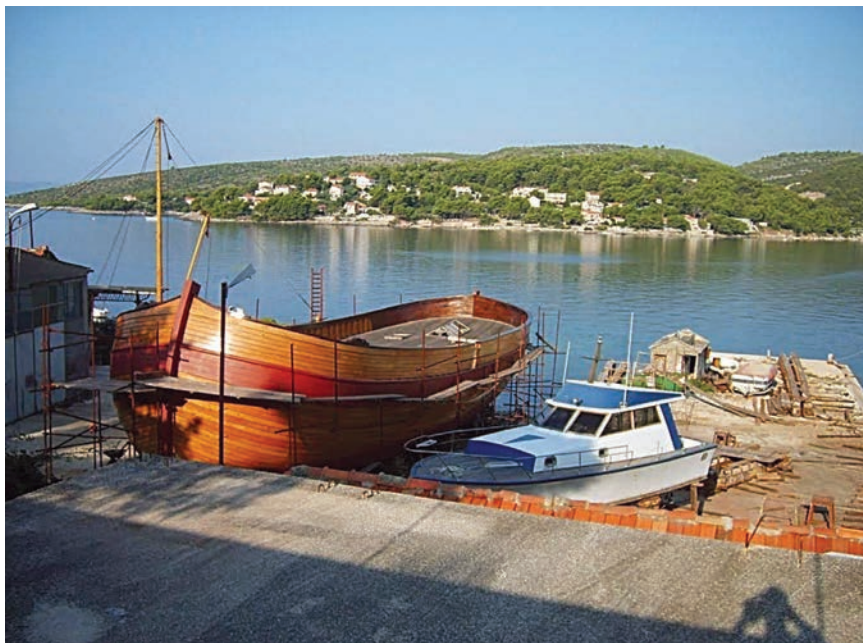
Brodogradilište za drvene brodove u Sumartinu na Braču