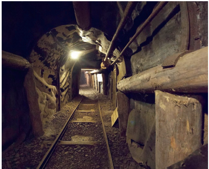
Obnovljeni ugljenokop u Labinu

Od energetske sirovine u Hrvatskoj vadio ugljen. Prvi je ugljenokop otvoren u Raši u Istri 1807., a istarski su ugljenokopi bili simbol podzemnog rudarstva u ovom dijelu Europe, vodeći po kadrovima i opremi te poznati po tehničkoj zaštiti od provala mora, eksplozivne ugljene prašine, metana i gorskih udara. Potom su otvoreni i ugljenokopi u Hrvatskom zagorju (prvi je bio Straža kraj Krapine 1587.), a slijedili su i ugljenokopi u Siveriću i Tepljuhu. U kršu se kopao i boksit, a vadio se i arhitektonsko-građevinski kamen (Brač, Pazin i Seget).