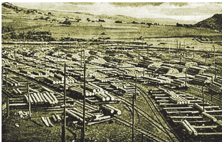
Skladište trupaca u Slavoniji na jednoj staroj fotografiji

Pilane s pogonom na vodu predstavljaju začetke industrijske proizvodnje u obradi drva. Takva su postrojenja imala tzv. venecijansku jarmaču (s drvenim jarmom i samo jednim listom pile na vo-