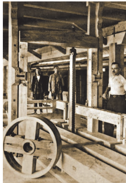
Jarmača kao začetak industrijske proizvodnje drva

zemljište za ispašu stoke. Šume su vrlo bezobzirno iskorištavali i razni osvajači, pa se područje Hrvatske pod šumama u međuvremenu znatno smanjilo. Vjeruje se da je u predtursko vrijeme i za vladavine Turaka (1544.-1699.) u Slavoniji pod šumom bilo gotovo 70 % površine, a prema povijesnim se izvorima zna da su i dalmatinski otoci bili vrlo šumoviti, o čemu, a o tome svjedoče i statuti pojedinih gradova.