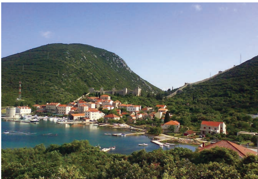
Mali Ston i njegove zidine

uske Stonske prevlake koja je pretežno pjeskovita i vjerojatno nastala nanosima. Vjerovali su da bi tako kao snažna pomorska sila lakše branili dragocjenu proizvodnju. Ipak odlučili su se da cijeli prostor zaštite zidinama, a razlog je tome bila činjenica da tadašnji prostor Dubrovačke Republike nije bio povezan s Pelješcem jer se to zbililo nešto poslije. Stoga je 1334. započela gradnja grandioznog pothvata, zašto su bili kao prvi projektanti angažirani i domaći graditelji Mihač i župan Bunič te Talijani Onofrio iz Napulja i Bernardin iz Parme, Francuz Olivier i Firentinac Michelozzo, a na kraju i protomajstori Juraj Dalmatinac i Paskoje Miličević pri usavršavanjima do kraja 15. st. Prvih je tridesetak godina građen obram-