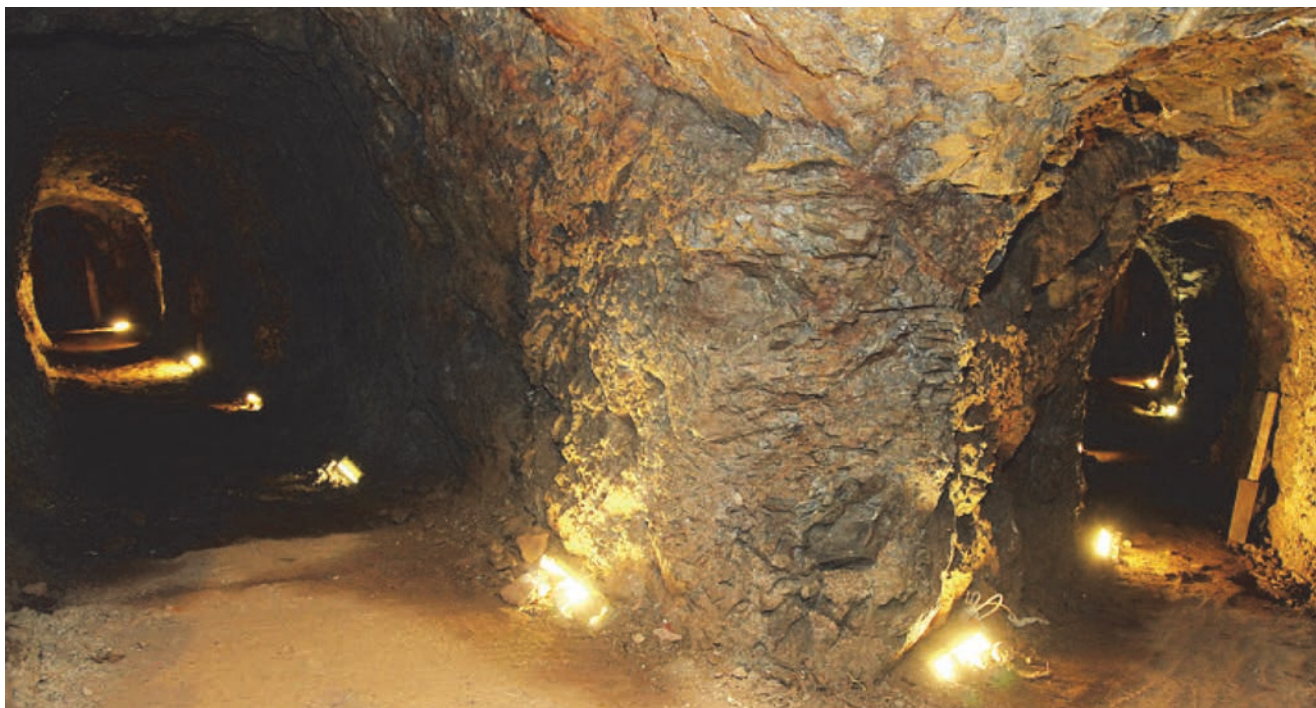
Obnovljeni rudnik Zrinskih na Medvednici

Frankopani su 1392. dobili odobrenje (regal) za istraživanje, kopanje i preradu zlata, srebra, bakra, željeza i drugih metala. Pretpostavlja se da su željeznu rudaču kopali u Gorskom kotaru (u Liču i Čabru) i u Lici (Rudopolje pokraj Vrhovina). Radilo se i na poznatim rudonosnim terenima Zrinske gore, Medvednice i Samoborskog gorja i u tome je najaktivnija bila slavna plemićka obitelj Zrinski, pa se pretpostavlja da je upravo na rudarstvu i bio zasnovan dio njihove goleme moći. Uostalom zna se da su kao vlastela i u Međimurju nadzirali i ispiranje zlata u Dravi i Muri.