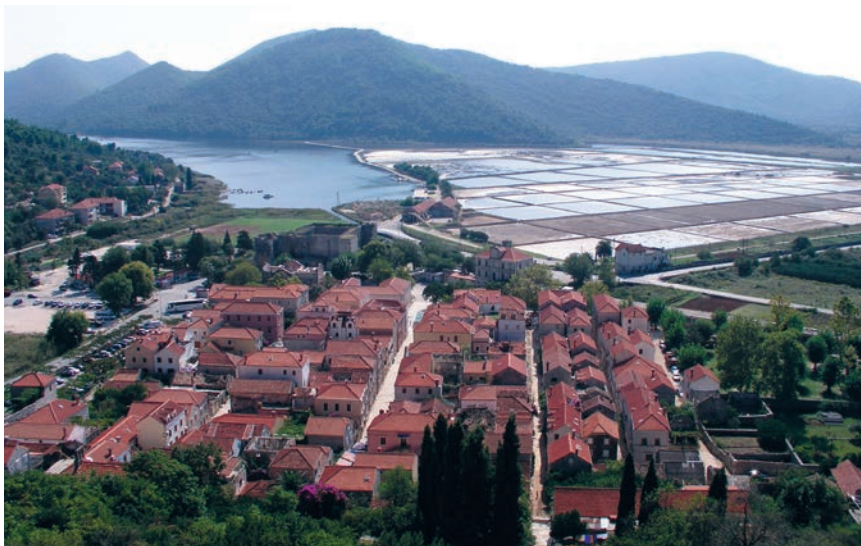
Pogled na Ston i Solanu

Mihajla s poznatim freskama. Naziv se poluotoka tijekom povijesti dosta mijenjao i glasilo je Stagnum, Stonski rat, Peliseo i Sabioncello, a riječ je Pelješac znatno mlađa i poklapa se s nazivom Pelisac za brdo iznad Orebiča (nazivaju ga i Zmijsko brdo). Dubrovačka Republika je 1326. osvojila Pelješac, a zatim ga 1333. kupila od srpskog cara Dušana i bosanskog bana Stjepana Kotromanića koji su na njega polagali pravo.