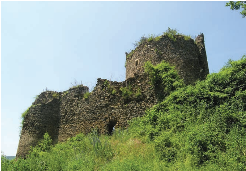
Ostaci utvrde Gvozdansko

Zrinski su oko 1530. razvili rudarsku aktivnost i u Gvozdanskom, gdje su već otprije prema povlastici iz 1463. kopali srebrnu i olovnu rudaču, čak i kovali srebrnjake. Tako je uostalom i nastalo jedno od najslavnijih poglavlja bogate hrvatske vojne povijesti jer su se branitelji, unatoč nedostatku streljiva, hrane i ogrjeva, hrabro držali puna tri mjeseca. Koliko se zna, tu je utvrdu nedaleko Une branilo pedesetak hrvatskih vojnika te 250 rudara sa ženama i djecom, podrijetlom iz Hrvatskog primorja. Obrana se Gvozdanskog, unatoč nedostatku streljiva, hrane i ogrjeva, držala punih 90 dana, a kada je ujutro 13. siječnja 1578. turska vojska konačno ušla u tvrđavu, zatekla je sve mrtve i smrznute branitelje.