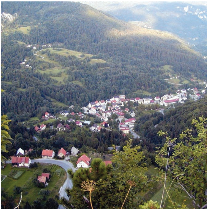
Grad Čabar bio je sjedište naše najdugovječnije manufakture

Prema urbarima, u željezari i rudnicima je radilo dvjestotinjak radnika, a proizvodi (čavli, potkove, oprema za kuhinje, željezne šipke za kovanje čavala, plugovi, obruči, mužari, lopate, čekići itd) prodavali su se širom Hrvatske i Ugarske, ali i cijelom Sredozemlju. Pogoni su nastavili s radom nakon Zrinsko-frankopanske urote i nakon što su nekoliko puta prodavani. Stradali su 1711. u velikoj poplavi Čabranke. Zanimljivo je da je godine 1720. izbila u Čabru pobuna koja je brzo ugušena, no to se smatra jednim od prvih radničkih štrajkova u Hrvatskoj. Tvornica je nastavila s radom, ali je 1785. ipak zatvorena, navodno zbog nedovoljne kvalitete željezne rudače. (nastavit će se)