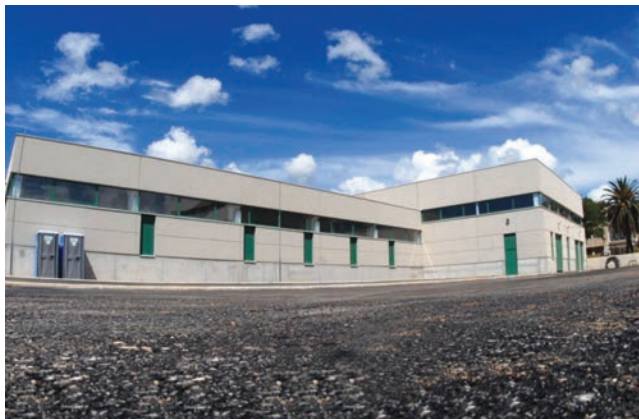
Uređaj za pročišćavanje otpadnih voda Divulje