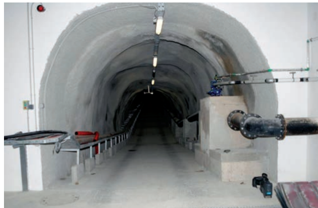
Hidrotehnički tunel Čiovo

(od Slatine do Trogira), obalni rub općine Seget te obalne rubove zapadnog i južnog dijela Čiova. Prostor je zapravo cjelina koja je omeđena planinskim lancem Kozjaka na sjeveru, Splitskim kanalom na jugu, gradom Solinom na istoku te Trogirskim zaljevom i zaljevom Saldun na zapadu. Inače je do 1992. za područje Kaštela i Trogira bilo izrađeno nekoliko rješenja odvodnje zasebnim kanalizacijskim sustavima, pa su se otpadne vode Kaštela nakon pročišćavanja trebale ispuštati u Kaštelanski zaljev, a vode Trogira, Okrugla i Segeta u Splitski kanal. Ipak nakon istraživanja mora i odgovarajućih studija usvojen je koncept odvodnje s jedinstvenim završnim dijelom, a to je rješenje s manjim izmjenama i izgrađeno. Riječ je isključivo o kanalizacijskom sustavu s otpadnom vodom kućanstava i industrije, za razliku od većeg dijela sustava Split – Solin gdje se radi o mješovitoj kanalizaciji.