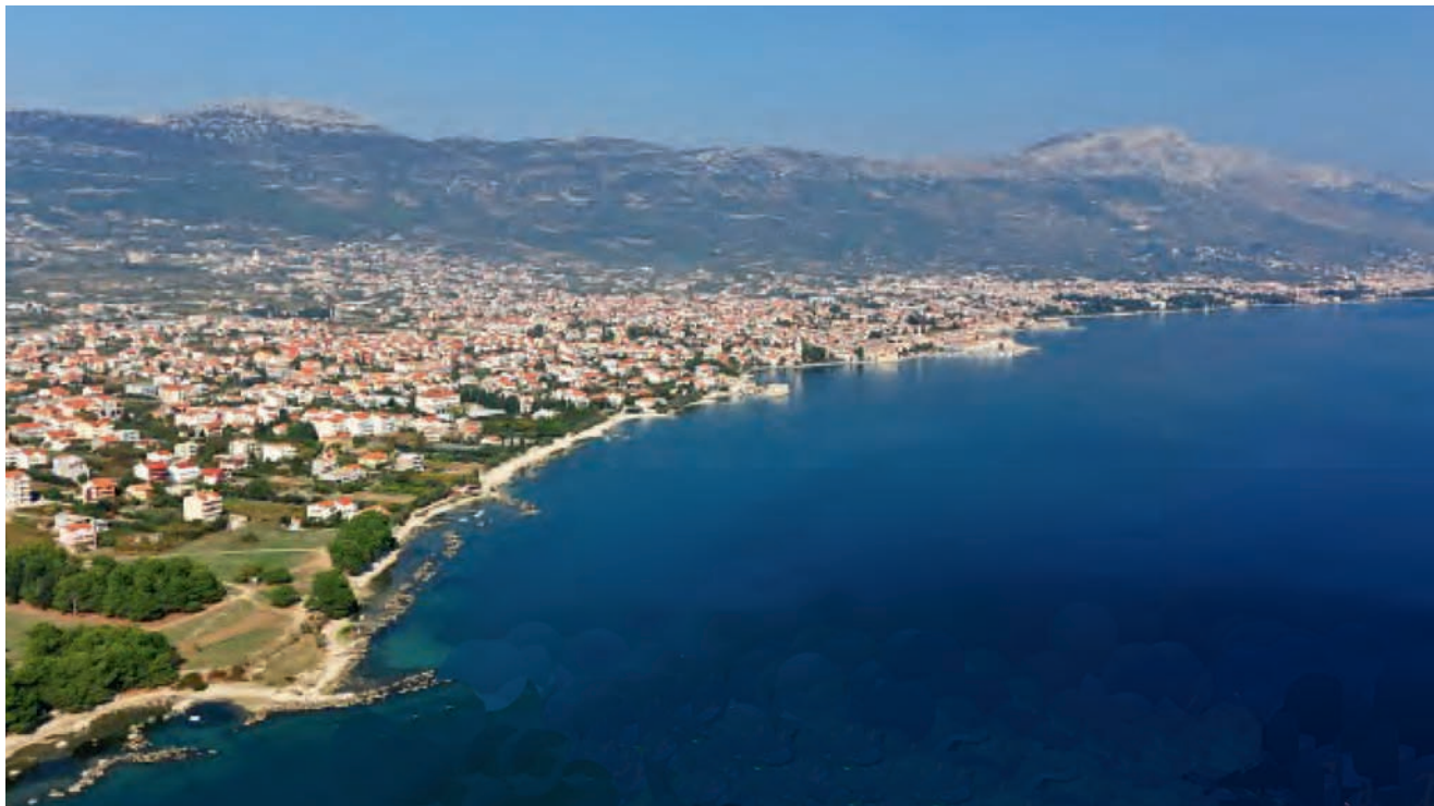
Dio naselja u Kaštelanskom zaljevu

prema gradnje svih potrebnih sadržaja. Projekt je zapravo bio jedinstven za sve gradove i općine na čijem su se području gradile građevine vodoopskrbe i odvodnje. Jedino je bilo važno da za pokrivanje domaćeg dijela financijskih sredstava svi građani plaćaju istu cijenu (0,16 eura po m 3 potrošene vode), neovisno o vrijednosti ulaganja na određenom području. U financiranje su uključeni zajmovi Svjetske (IBRD) i Europske (EBRD) banke za obnovu i razvoj koje su dale 30,7 i 33,2 milijuna eura (uglavnom su vraćeni iz naknade što se ubire pri potrošnji vode) i jedan naknadni zajam od 14,25 milijuna eura (što ukupno daje 667,76 milijuna kuna). Dio se sredstava namiruje iz naknade za rješavanje imovinskopravnih odnosa, dio prilažu Hrvatske vode , a dio se dobije iz ostalih izvora, premda čak 41 % (prema revidiranom investicijskom programu iz 2013.) dolazi iz državnog proračuna. Sve to u dosadašnjem djelovanju projekta ukupno daje 2,022 milijardi kuna. Integralni projekt zaštite Kaštelanskog zaljeva obuhvaća područja gradova Splita, Solina, Kaštela i Trogira te općina Seget, Okrug, Klis, Dugopolje, ali i dio otoka Čiovo. Projekt se provodi kroz četiri pot-