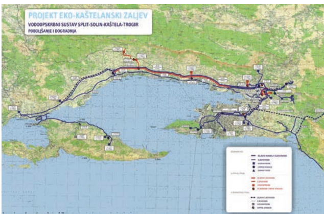
Shema potprojekta Poboljšanja i dogradnje vodoopskrbnog sustava

Upravo završeni Kanalizacijski sustav Kaštela – Trogir bio je i najzahtjevniji dio cijelog projekta, što između ostalog potvrđuje i podatak da je trebalo dobiti čak 20 građevinskih dozvola. Taj prostor obuhvaća cijeli sjeverni obalni rub Kaštelanskog zaljeva , od istočne administrativne granice Kaštela do Trogira na zapadu, obalni rub sjevernog dijela Čiova