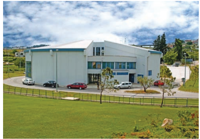
Crpna stanica Ravne njive

skoju luci, sastoji od kanalizacije područja Vranjica (obuhvaća tri crpne stanice te tlačne i gravitacijske kolektore), hidrotehničkog tunela Stupe (dugog 2512 m), podmorskog ispusta Stobreč (s jednom crpnom stanicom i 3165 m cjevovoda, od čega 2750 m podmorskog ispusta), mreže slivova Dujmovača – Solin (kolektor dug 12 km s dvije glavne crpne stanice), uređaja za pročišćavanje Stupe (u prvoj je etapi izgrađen mehanički stupanj pročišćavanja, planirani je kapacitet 2010. bio 135.000 ES, a 2025. se očekuje 208.000) i hidromehaničke opreme te dodatne kanalizacijske mreže Stobreča i Stročanca (kolektor 9 km i dvije crpne stanice). O kanalizacijskom sustavu Kaštela – Trogir pisat ćemo poslije nešto detaljnije, a projekt Poboljšanja i dogradnje vodoopskrbnog sustava Split – Solin – Kaštela – Trogir , koji se opskrbljuje s izvora rijeke Jadro u Solinu (izvire na 34 m n.v., 4 km od središta Solina ), obuhvaća područja