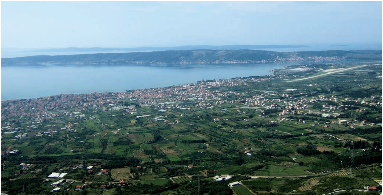
Pogled na Kaštelski zaljev s obronaka Kozjaka

čak smatrali kako imaju kanalizaciju (riječ je o cijevima ispod stare Kaštelske ceste), a nisu bili ni svjesni da su priključeni na ispuste koji se izljevaju u luke i lučice i znatno onečišćuju more.