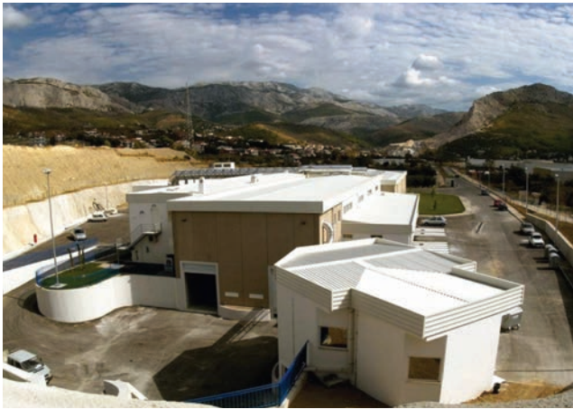
Dio sadržaja uređaja za pročišćavanje Stupe