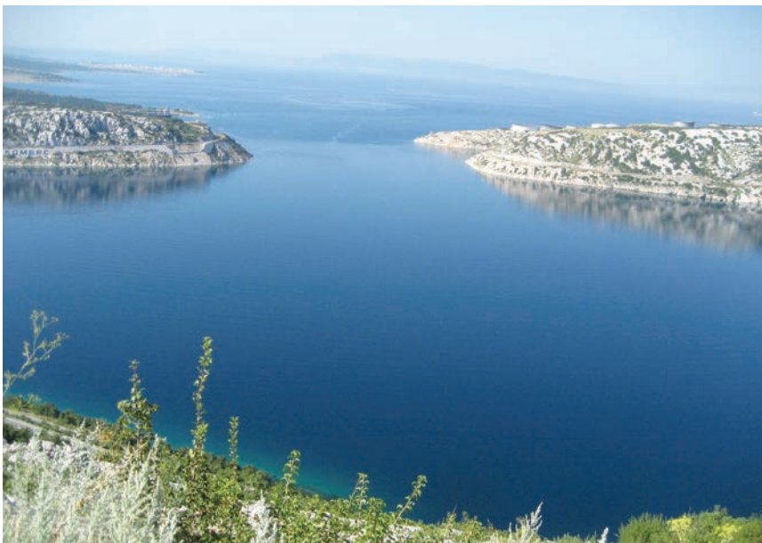
Pogled na izlazni dio Bakarskog zaljeva

Projekt zaštite mora Splita, Solina, Kaštela, Trogira i okolnih općina bio je jedan od najvećih infrastrukturnih zahvata na cijelom Sredozemlju