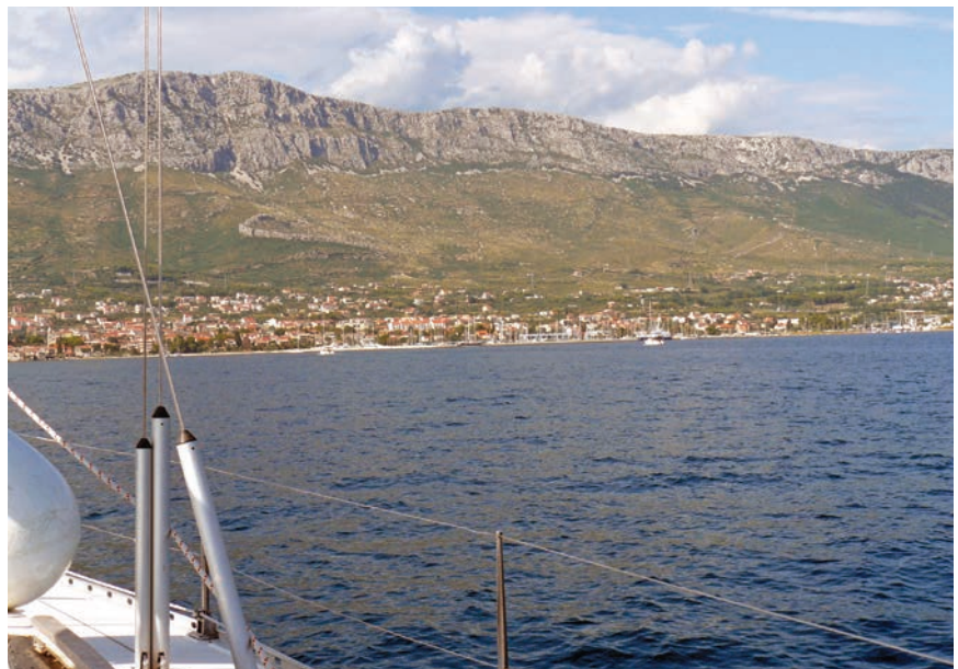
Dio grada Kaštela gledan s mora

htjevnom poslu koji će, kako se predviđa, trajati možda i dvije godine. Kad se sve to dovrši, ostvarit će se dvostruka dobit – velik će se broj kućanstava spojiti na kanalizacijski sustav, a svi će opasni ispusti u Kaštelski zaljev biti zatvoreni ili sanirani. Radi se inače o starim azbestno-cementnim ispuštima, starima i do četrdeset godina, koji su često i propusni. Njihova se sanacija obavlja posebnom