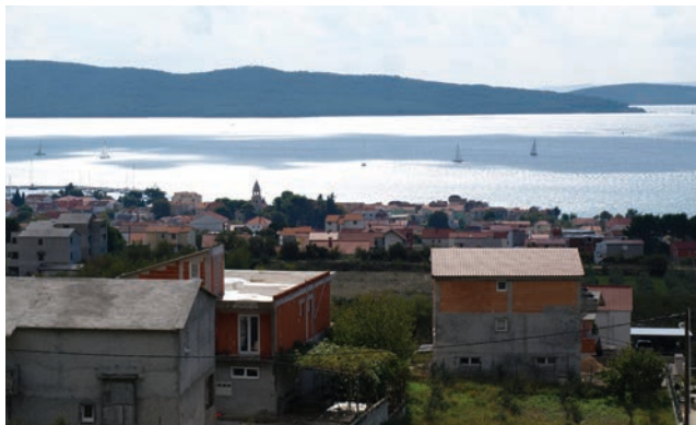
Detalj Kaštelanskog zaljeva s Marjanskim poluotokom u pozadini