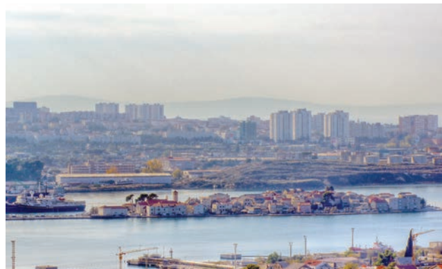
Vranjic se priprema za dolazak turista

tehnologijom, kolokvijalno nazvanom "čarapa", tako da se u ispuste ulazi posebnim kamerama koje pronalaze oštećenja i potom se oblažu posebnom smjesom i tako cijev postaje nepropusna. Korisnici starih ispusta nigdje nisu evidentirani, pa se kamera koja služi za snimanje kolektora koristi i za evidenciju priključaka. Sada je samo 15 posto kućanstava u Kaštelima spojeno na novi kanalizacijski sustav, a jedan je broj priključen za potrebe probnog rada. Za usporedbu valja istaknuti da po direktivama Europske unije mora biti 80 do 85 posto stanovništva priključeno na vodoopskrbnu i kanalizacijsku mrežu. Kako je vodoopskrba uglavnom riješena, pokušat će se kanalizaciju osigurati financijska sredstva iz EU fondova i upravo se rade odgovarajući projekti i studije utjecaja na okoliš. Kad se dobiju potrebna sredstva, istodobno bi se rješavao problem odvodnje i vodoopskrbe gdje je to potrebno jer će se cjevovodi postavljati u isti rov.