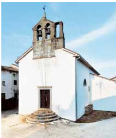
Crkva Presvetog Trojstva u Račicama

Kaštel je danas barokna rezidencija iz 18. st., a nastao je nadograđivanjem i preuređenjem starije renesansne, možda i srednjovjekovne utvrde. Riječ je o stambeno-obrambenom kompleksu koji se sastoji od trokutastoga utvrđenog dvorišta, manje gospodarske građevine naslonjene na sjeverni obrambeni zid te pročeljnoga dvokatnoga ulaznog krila na istočnoj strani. Vanjsko je pročelje ukrašeno lijepim polukružnim portalom, a iznad njega je balkon s kovanom željeznom ogradom. Premda je u 18. st. dvorac temeljito obnovljen, o negdašnjoj obrambenoj namjeni osim bedema svjedoči i skošeno podnožje stambenoga krila te obrambeni jarak