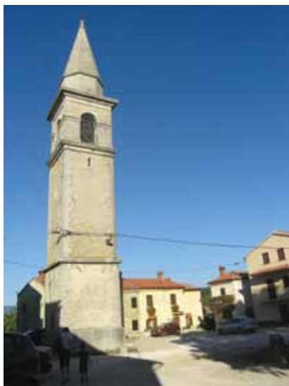
Zvonik župne crkve Sv. Križa

19. st., ali pozornost privlači oltarna slika Sv. Fabijana i Sv. Sebastijana koju je 1846. naslikao Venerio Trevisan (1797.–1871.), slikar iz Vodnjana. Oltarna pala Svete obitelji, Sv. Valentina i Sv. Antuna Opata potječu iz 17. st., a grobnice i orgulje iz 18. st. Uz crkvu je i samostojeći zvonik, izgrađen kao visoki pravokutni toranj čiji je najviši dio na svim stranama otvoren lučnim prozorima te natkriven manjim osmerokutnim tamburom i stožastom piramidalnom kapom.