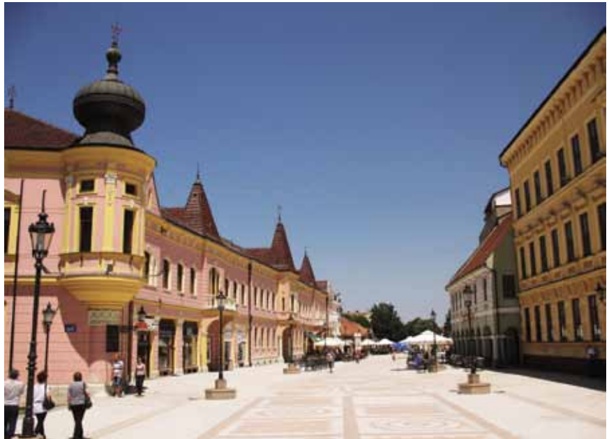
Središte Vinkovaca (lijevo zgrada Brodske imovne općine)

Na kraju smo posjetili i investitora – Hrvatske šume d.o.o., Upravu šuma Podružnica Vinkovci, koja je smještena u središtu Vinkovaca, na Trgu bana Šokčevića 20, u zgradi negdašnje Brodske imovne općine. Ta je golema i lijepa zgrada nastala neobaroknom i neorenesansnom restauracijom zgrade uredovnice odnosno direkcije šuma Brodske imovne općine te dogradnjom neogotičkog dijela u Ulici kralja Zvonimira. Malo je poznato da je ta reprezentativna zgrada građena od 1909. do 1912. (konačan je oblik dobila 1916.) prema projektu slavnog Hermana Bolléa. Iznad ulaznih vrata su reljefni ukrasi sa simbolima šuma i šumarstva ovoga kraja, a na zgradi je i spomen-ploča Josipu Runjaninu, skladatelju hrvatske nacionalne himne. Bila je teško oštećena u Domovinskom ratu, a obnovile su je Hrvatske šume .