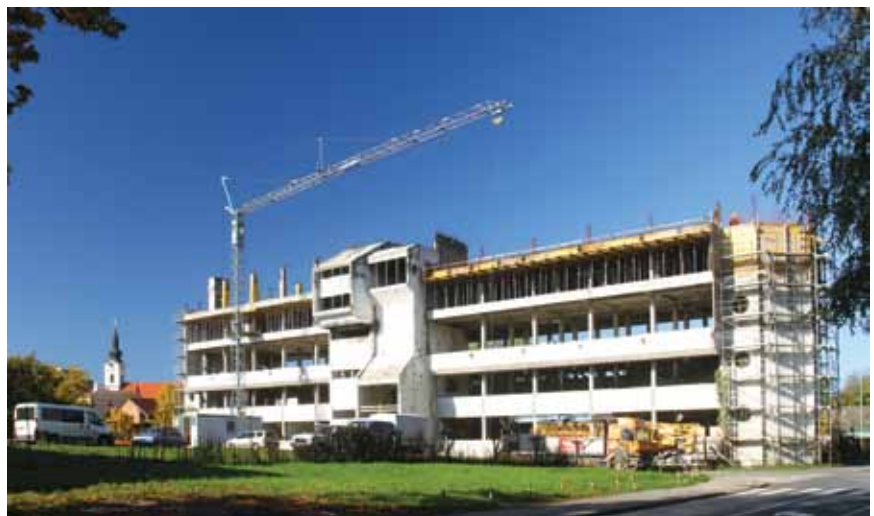
Početak obnove zgrade PIK-a Vinkovci