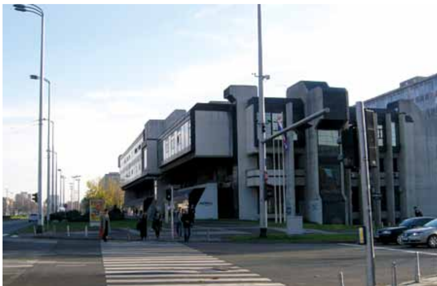
Zgrada Ina-projekta u Zagrebu

2009., a najpoznatija su mu djela zgrade Auto-Hrvatske (danas Raiffeisen banke) i INA-projekta u Ulici grada Vukovara te poslovna zgrada do Vjesnikova nebodera, građena kao Press-centar Univerzije u Zagrebu te TE Rijeka I u Urinju. Zanimljivost je da nitko od kritičara koji često hvale njegova djela ne ističe zgradu PIK-a Vinkovci , iako se spominju dvije osnovne škole u vinkovačkom kraju (u Ivankovu 1970. i u Vinkovcima 1979.), ali i pogoni Kraša i Audiološki centar u Zagrebu, vodotoranj u Kistanjama te spomenik žrtvama fašizma u Podhumu na Grobničkom polju (s kiparom Šimom Vulasom). Najviše se hvali zgrada Auto-Hrvatske u Zagrebu za koju se doslovno tvrdi da bi je i danas "mnogi rado supotpisali" iako svi kritički osporavaju njezinu neprimjerenu adaptaciju u sjedište jedne banke, čak je to učinio i autor u novinskim intervjuima pri uručivanju nagrade za životno djelo. Već je rečeno da nitko posebno ne ističe također nesretnu upravnu zgradu PIK-a Vinkovci . Doduše autor je svrstava među pet izgrađenih s kojima je najzadovoljniji, što je naveo i na kraju svoje knjige, a to su, uz dvije zgrade u Ulici grada Vukovara u Zagrebu i termoelektranu Urinj, još dvije poslovne zgrade u Osijeku i Vinkovcima – Obnova i PIK Vinkovci .