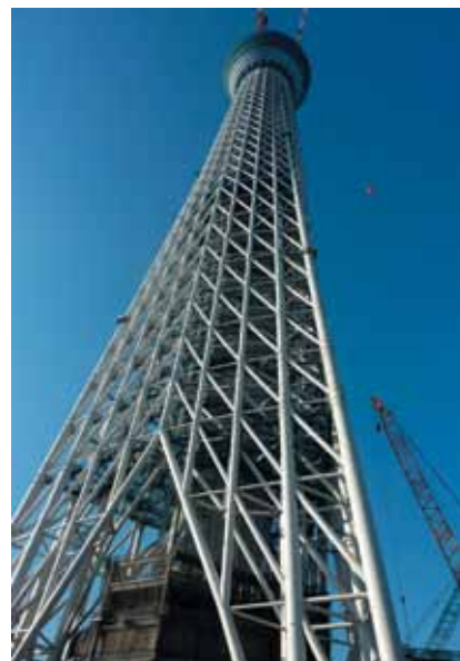
Detalj konstrukcije tornja

tronnas Towers (451,9 m), čak i građevinu koja je izgrađena, ali još nije otvorena – toranj sa satom Abraj al Bait u Meki (601 m). Novi je tokijski toranj gotovo dvostruko nadmašio prethodnu najvišu japansku građevinu Tokyo Tower (333 m). Valja reći da su obje građevine iznimno hrabar i zahtjevan tehnološki podvig s obzirom da se radi o jednoj od najaktivnijih seizmičkih zona na svijetu. Oba je nebodera izgradila japanska građevinska tvrtka Nikken Sekkei u suradnji sa stotinjak projektanata – arhitekata, građevinskih i srodnih inženjera,