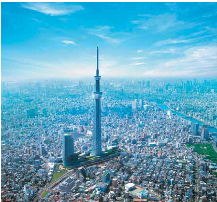
Novi najviši toranj u Tokiju

urbanista i sl. Novi je "supertoranj", kako ga u Japanu često nazivaju, sigurniji od bilo koje druge slične građevine iako mu je odnos visine i širine 9:1, a to znači da je vrlo uzak i vitak, gotovo u obliku igle. Tornjevi Sky Tree i Tokyo Tower ponajprije su televizijski odašiljači. Stariji je tokijski toranj, izgrađen 1958., imao dovoljnu visinu koja se s prijelazom na digitalno emitiranje pokazala nedovoljnom za područje koje je trebala pokriti. Sky Tree je u prizemnoj razini tripod (tronožac) koji stoji na bazi istostraničnog trokuta sa stranicama od po 68 m. Kako se toranj uspinje, presjek se postupno mijenja od trokuta u krug, pa tako postaje potpuno cilindričan toranj između polovice i dvije trećine svoje visine. Prije početka projektiranja inženjeri su morali proučiti uvjete na nadmorskoj visini od 600 m. Da bi to ostvarili, u zrak je podignut meteorološki balon koji je trebao prikupiti opsežne podatke, a najvažniji su bili podaci o vjetrovima kako bi se proniknulo u bočne sile vjetra koje