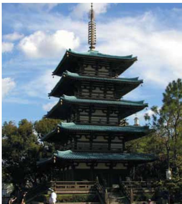
Tradicionalna peterokatna pagoda