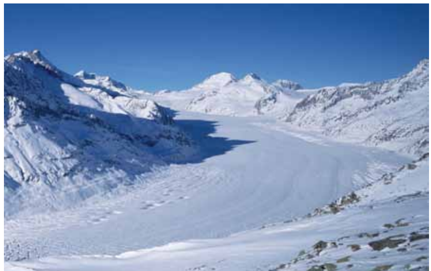
Snijeg u gorskim predjelima kao primjer čistog okoliša

okoliša i prirode. Opće je uvjerenje da će sve obveze što ih je Hrvatska preuzela tijekom procesa pregovaranja u području zaštite okoliša i prirode pridonijeti poboljšanju i unapređenju kvali-