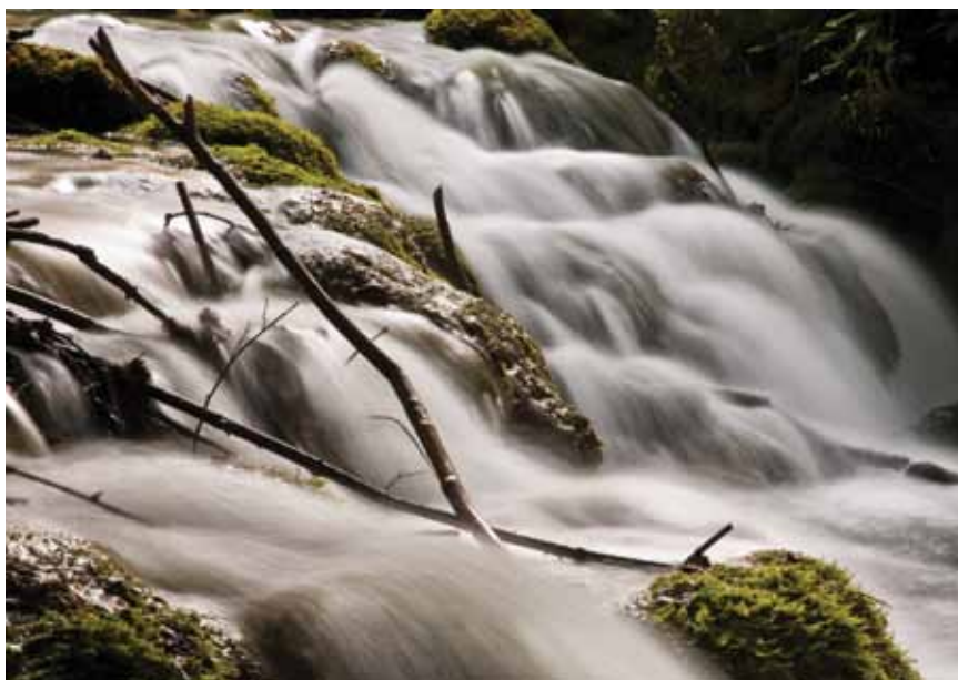
Voda na Plitvičkim jezerima

U području zaštite prirode obvezni smo do ulaska u Uniju izraditi prijedlog područja koja će postati dijelom europske ekološke mreže Natura 2000, najveće koordinirane mreže područja očuvanja pri-