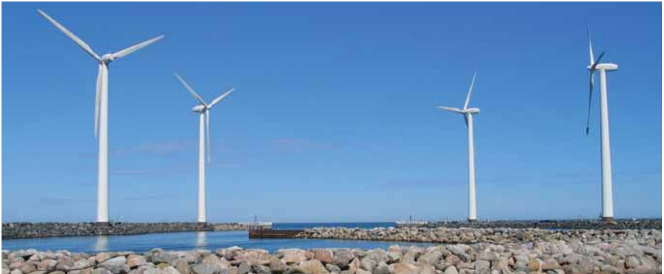
Vjetroelektrane su jedan od obnovljivih izvora energije

rode u svijetu. To će pridonijeti očuvanju ugroženih divljih vrsta i staništa. Natura 2000 podržava načelo održiva razvoja, a cilj nije zaustaviti ljudske aktivnosti već odrediti veličine prema kojima se mogu obavljati uz istodobnu zaštitu biološke raznolikosti. Natura 2000 je preduvjet koji upotpunjuje zahtjeve ekološkog (ruralnog) turizma i ekološke poljoprivrede, ali pruža brojne mogućnosti ljubiteljima prirode i zdravog načina života. Ostvarivanje ciljeva ekološke mreže Natura 2000 praćeni su i snažnom europskom politikom te financijskom potporom iz fondova Europske Unije.