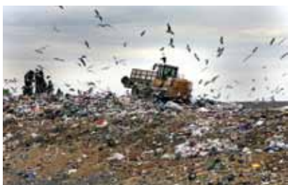
Uobičajeno odlagalište otpada

kemikalije (ECHA – European Chemicals Agency) koja od sredine 2008. radi u Helsinkiju. Agencija će usklađivati procjenu registriranih kemikalija i održavati javnu bazu podataka u kojoj će potrošači i stručnjaci pronalaziti tražene podatke. Posao je započeo s kemikalijama koje se upotrebljavaju u najvećim količinama i koje predstavljaju najveću opasnost. Ako postoji sigurnija tvar, opasnija će se morati zamijeniti. Proizvođači su obvezni dokazati da su im proizvodi sigurni za uporabu. Propisi REACH trebali bi poboljšati zaštitu ljudskog zdravlja i okoliša te potaknuti inovativnost i konkurentnost u kemijskoj industriji unutar Europske Unije.