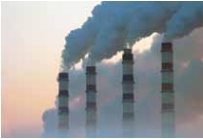
Poseban su problem industrijski ispušni plinovi bez pročišćavanja

Osnovni su ciljevi i načela zaštite okoliša danas utvrđeni u glavi XX. Ugovora o funkcioniranju Europske Unije. Prema članku 191. Ugovora o funkcioniranju Europske Unije, politika u području okoliša ima sljedeće ciljeve: