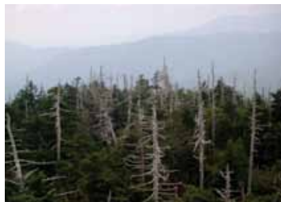
Kisele kiše uzrokuju propadanje šuma

Europski parlament i Vijeće, i u skladu s redovnim zakonodavnim postupkom suodlučivanja (čl. 192. stavak 1.) te savjetovanja s Gospodarskim i socijalnim odborom i Odborom regija, odlučit će koje mjere valja poduzeti. Iznimno, Vijeće u skladu s posebnom procedurom i nakon savjetovanja s Europskim parlamentom, Gospodarskim i socijalnim odborom te Odborom regija, jednoglasno donosi ponajprije odredbe fiskalne naravi, mjere koje utječu na prostorno planiranje, kvantitativno upravljanje vodnim resursima te izravno ili neizravno utječu na njihovu dostupnost, iskorištavanje zemljišta s iznimkom za gospodarenje otpadom, mjere koje znatno utječu na izbor država članica između različitih izvora energije i opću strukturu opskrbe energijom.