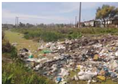
Primjer "divljeg" odlagališta otpada koje zagađuje i tlo i vodu

Sustav trgovanja emisijama Europske Unije posebno pomaže održanju obećanja o smanjivanju emisija ugljičnog dioksida i ostalih tzv. stakleničkih plinova. U sustavu trgovanja emisijama, vlade EU-a industrijskim i energetske poslovnim subjektima izdaju kvote koje ograničavaju količinu emitiranoga ugljičnog dioksida. Poduzeća koja ne iskoriste svoje kvote u potpunosti mogu prodati višak tvrtkama čije ih emisije znatno premašuju. Kupnjom prava na kvote, tvrtke koje premašuju granicu emitiranja štetnih plinova izbjegavaju plaćati velike novčane kazne. Prodajom kvota tvrtke osiguravaju sredstva za ulaganje u tehnologiju koja je manje štetna za okoliš. Svaka tvrtka u sustavu donosi svoje odluke na temelju onoga što je najbolje za njezino poslovanje, bez intervencija vlade, sve dok se postigne smanjivanje emisija štetnih plinova.