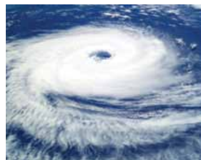
Zračni snimak uragana Katrina iz 2005.

Ujedno se pokušava postaviti standard za onečišćenje zraka koje će pratiti i druge države u svijetu, pa će usvajanja čistih tehnologija dati prednost tvrtkama iz Europske Unije.