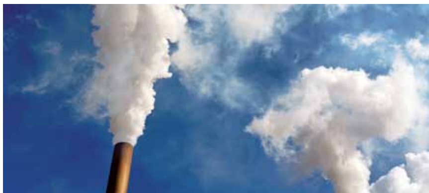
Industrija uzrokuje velika onečišćenja zraka

Unatoč tome, okoliš je područje koje se najteže može kontrolirati. Države članice mogu zajednički uživati u europskim prirodnim ljepotama, no moraju dijeliti i terete poput kiselih kiša, zagađene vode, onečišćenog zraka i odlaganja otpada. Kako su krajnji vremenski uvjeti sve češća pojava, to ujedno znači da klimatske promjene utječu na građane i politiku zaštite okoliša na svim razinama.