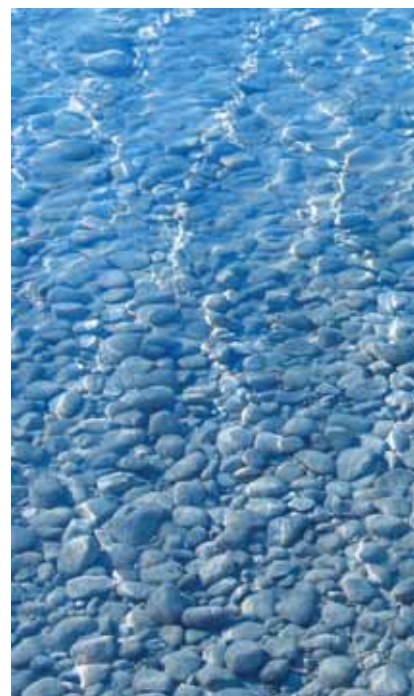
Detalj čistoga mora

Za Hrvatsku je u pregovorima omogućeno povećanje prodajne količine emisijskih jedinica na dražbi za 26 posto u odnosu na baznu kvotu određenu za svaku dr-