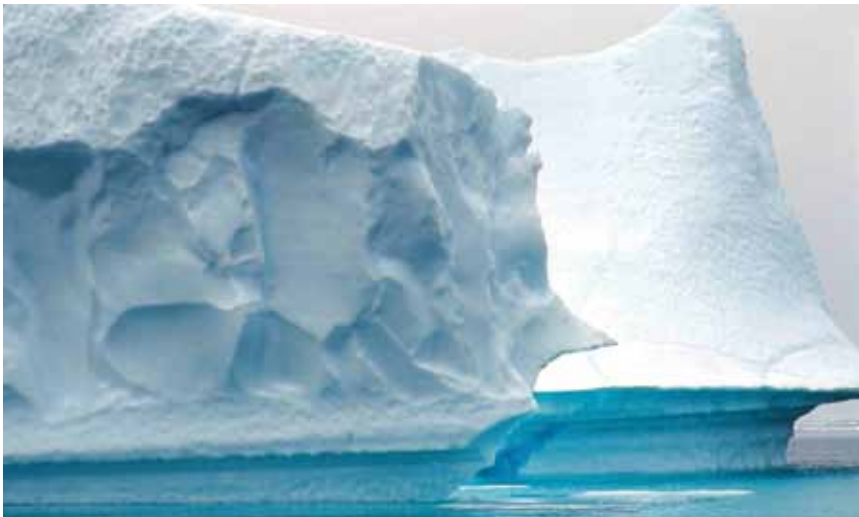
Globalno je zatopljenje uzrok topljenja ledenjaka

Na području kakvoće voda osigurano je prijelazno razdoblje do kraja 2023. kao krajnji rok za gradnju sustava odvodnje i pročišćavanja komunalnih otpadnih