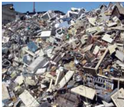
Otpad električnih i elektroničkih uređaja

programe sprječavanja stvaranja otpada, promjene tržišta reciklaže, promicanje gospodarskih sredstava, poput poreza na odlagališta u nekim državama, te na modernizaciju zakona o otpadu.