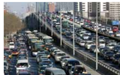
Pojačani promet cestovnih vozila uzrokuje znatne emisije stakleničkih plinova

Borba je protiv klimatskih promjena glavni izazov u zaštiti okoliša. Klima se opterećuje uporabom fosilnih goriva (ugljena, plina i nafte) u kućanstvima, automobilima i industriji. Iz tih su goriva emisije ugljičnog dioksida veće nego što ih atmosfera može apsorbirati bez podizanja ukupne temperature. Zato da bi se očuvao naš planet treba ograničiti prosječno povećanje temperature u svijetu na 2 °C iznad predindustrijske razine. Europska Unija predvodi borbu protiv klimatskih promjena, posebno smanjivanjem potrošnje energije i emisija stakleničkih plinova, pa je i primjer ostatku svijeta. Ujedno potiče usvajanje sličnih mjera širom svijeta, posebno u industrijaliziranim zemljama i brzorastućim gospodarstvima.