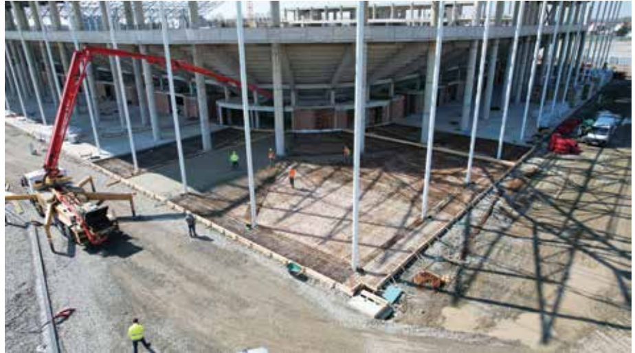
Konstrukcija krovne rešetke i tankih stupova s vanjske strane stadiona

Za novinare i fotografe planirani su ormarići u kojima će moći ostaviti opremu te potom s akreditacijama ući u dvoranu za medije, u koju će igrači ulaziti iz svlačionica. Nakon konferencije novinari će izlaziti u prostor s dizalom i odlaziti na treći kat gdje se nalaze komentatorske kabine i mjesta za novinare. S tih se mjesta novinarima pruža krasan pogled na teren i čitav stadion kao i vrhunski prostor za rad. Naime, u UEFA-inoj knjižici piše kako novinari imaju velik utjecaj na dolazak navijača, gostiju i samu atmosferu na stadionu. Što su zadovoljniji, oni dolaze u puno većem broju te više ljudi