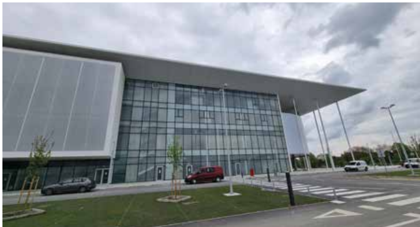
Jedno od pročelja stadiona