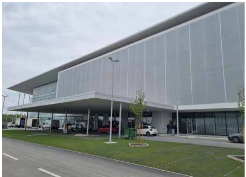
Detalji fasade na zapadnoj strani stadiona