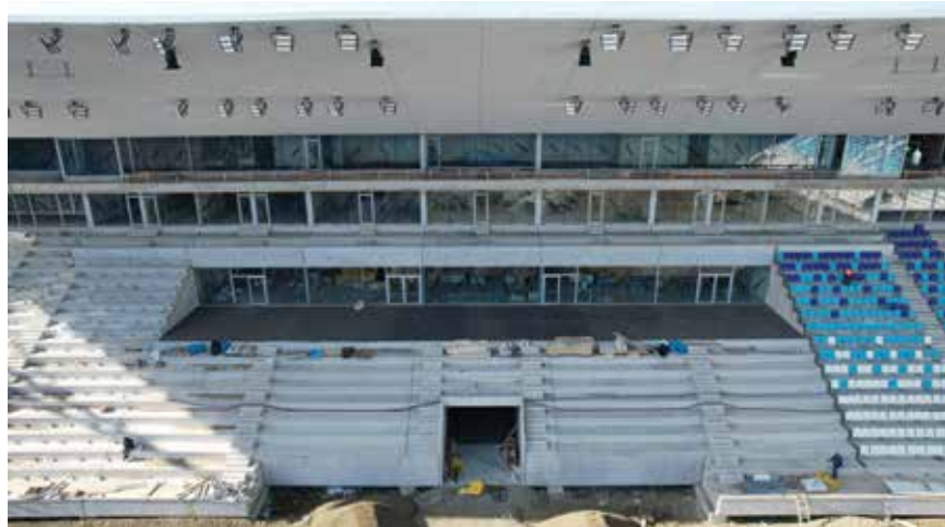
Postavljanje stolica na tribine stadiona

gradnju. Zato je i Grad odlučio produžiti promenadu, šetnicu uz Dravu. Što se tiče prometa, planirana je izgradnja prometnoga mosta preko Drove kojim bi se povezala obilaznica kojom bi se najbrže stizalo do stadiona.