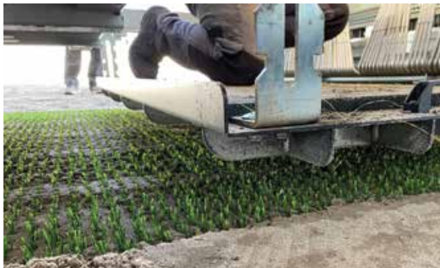
Izvedba travnjaka na stadionu NK Osijek