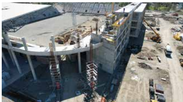
Detalji s gradilišta

Drave. Prostire se na građevinskoj čestici nepravilnoga oblika ukupne površine veće od 15 ha. Na čestici je izgrađen sustav prometnih površina: internih cesta, pješačkih staza i parkirališta. Parkirališta su izvedena opločnicima između kojih je trava, završnu oblogu pješačkih površina čine betonski opločnici, a interne su ceste izgrađene asfaltnim zastorom. Sve su pješačke površine izvedene uzdignuto od manipulativnih površina, omeđene i izdignute cestovnim rubnjacima. Ukupni broj parkirališnih mjesta je 885. Na parceli su posađena nova stabla, a površine su ozelenjene. Stadion je spojen na kompletnu infrastrukturu.