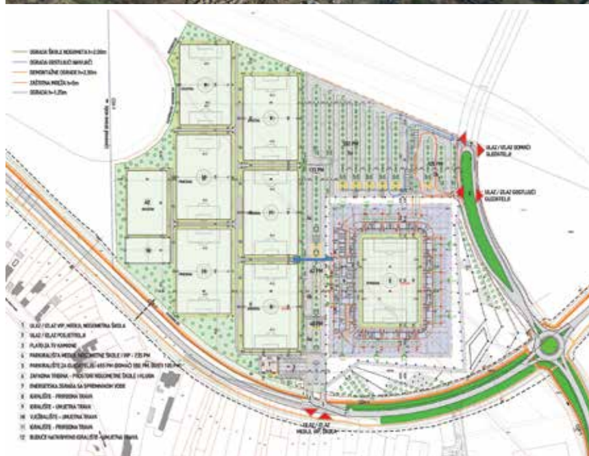
Situacija stadiona NK Osijek