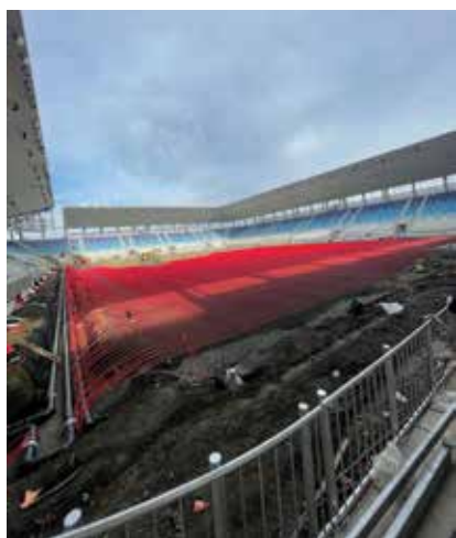
Priprema terena za travnjak na stadionu NK Osijek

Stručni je nadzor proveden odmah nakon faze mlaznoga injektiranja stupnjaka i izvedbe temeljnoga roštilja, točnije od li-