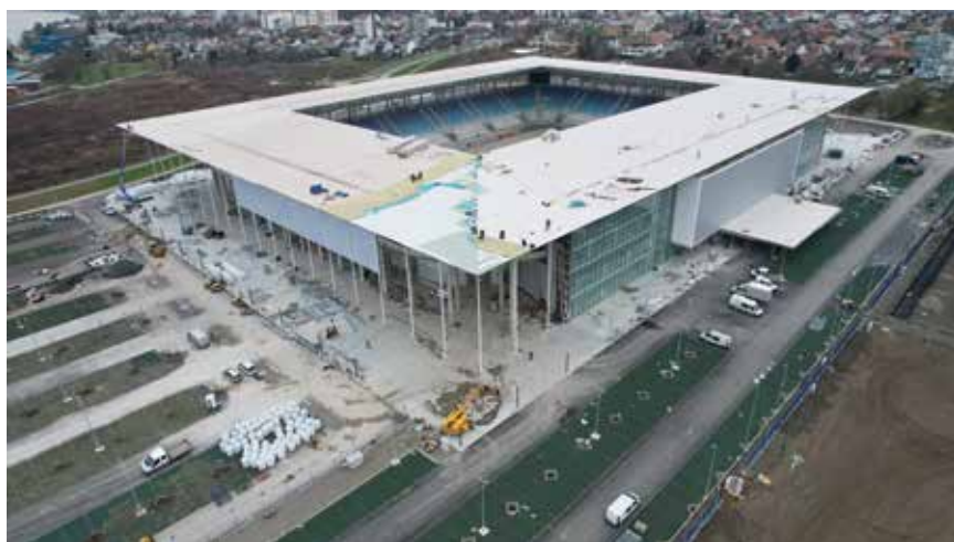
Detalji krovne konstrukcije

nelogičnosti: nigdje nema stupa ili grede koji mogu biti sakriveni, sve su instalacije sakrivene.