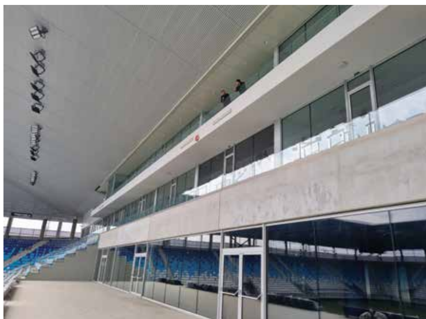
VIP lože i prostor za novinare (iznad njih)

Kao što je već spomenuto, investicija u stadion iznosila je 65 milijuna eura. Procjena je da stadion IV. kategorije po UEFA-inoj listi stoji 2500 eura po stolici u gledalištu. Stadion NK Osijeka koštao je oko 5000 eura po stolici, ali ne zbog neracionalnosti projekatana i izvođača, već toga što se pored njega nalazi i kamp (sedam terena), a već je spomenut i problem kvalitete izvornoga terena. Radi se o 500 pilota i nasipavanju 15 ha površine visine 1,5 m kamenom mješavinom.