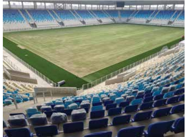
Gledalište stadiona NK Osijek, sa svih se pozicija vidi aut-linija igrališta

te zaslužuje i takav stadion. Željelo se da građevina bude monumentalna, ali ne i robusna. S obzirom na to da je uz Dravu, trebala je biti "prozračnija". To je odredilo izbor materijala i boja. Došlo se na ideju da se krovom izrazi estetsko-arhitektonski stav, iako on zadovoljava svoju primarno funkcionalnu namjenu. Ispod pravokutnika krova upisan je sam stadion. Zatim je odlučeno da kutovi neće biti poligonalni, već zakrivljeni, što je dovelo do nježne polikarbonatne fasade. Tanki stupovi koji s vanjske strane stadiona podržavaju krov tvore pravokutnik, ali omogućavaju prozornost pogleda na stadion, ovisno o kutu gledanja. Prozračnom fasadom dobivena je monumentalnost i stadion izgleda kao da može primiti 20.000 ljudi. Školjka stadiona proizišla je iz broja ljudi i brojnih propisa. Na primjer, vatrogasni su propisi diktirali udaljenost ulaza i stubišta od sjedala na tribinama. Može se reći da je puno parametara bilo unaprijed zadano i da su oni utjecali na oblik stadiona, no nije se željelo da fasada bude klasična kao na brojnim stadionima i da ju određuju nosivi elementi. Projektant Salitrežić pronašao je materijal, polikarbonat, koji je poluproziran. Danju zadržava svoju gustoću, a u sumrak i zoru reflektira okolinu. Noću se pale lampe zahvaljujući kojima fasada mijenja boju, a mogu se ispisivati i razne poruke (rezultati i sl.). Učinak je vrlo zanimljiv i svi su jako zadovoljni rješanjem fasade.