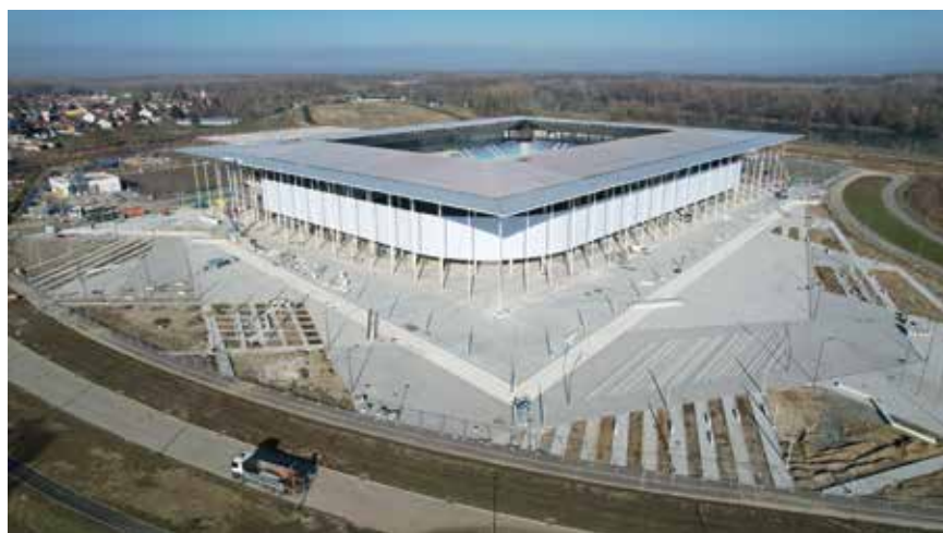
Gradilište u travnju 2023.

Građevina sportsko-rekreativne namjene Škole nogometa i stadiona NK Osijeka sagrađena je u središtu Osijeka. Orijentacije je sjever-jug i okomita na tok