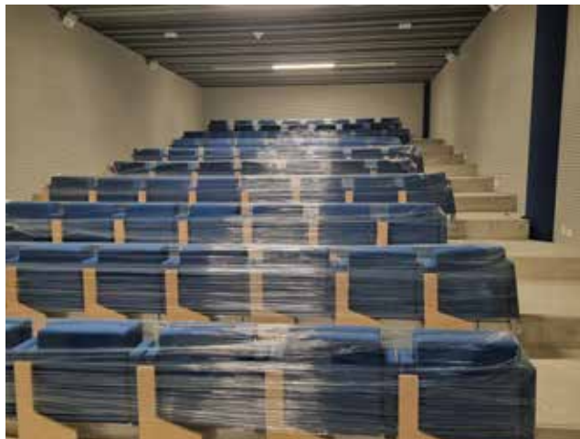
i dvorane za novinarske konferencije

ni travnati pokrivač ojačan sintetičkim vlaknima. Razvijena su posebna vlakna s poboljšanim karakteristikama performansi GrassMax Duo od blokni kopolimera koji kombinira PP i PE kao i ravne i teksturirane niti. Poseban oblik i materijal šavova testiran je u znanstvenome laboratoriju Sveučilišta Ghent. Šivanje polja filamentima izvode specijalizirani strojevi.