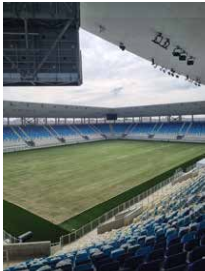
Dva velika semafora stadiona

sve su tribine istoga poprečnog presjeka te su ispod njih sanitarni čvorovi, prostori ugostiteljskih sadržaja, pritvori i smještaj za policiju. Čak 18 ulaza na stadion omogućuje brzo pražnjenje i punjenje stadiona.