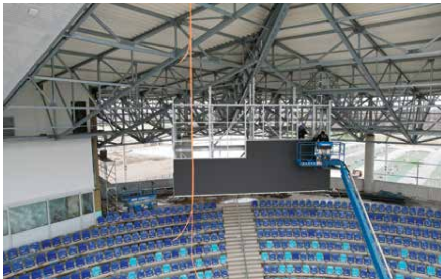
Montaža velikog semafora

Zapadna je tribina u svojoj funkcionalnoj naravi sportsko-poslovna građevina na četiri etaže. U prizemlju su glavne svlačionice obaju timova s pripadajućim prostorijama, sedam svlačionica Škole nogometa i soba za novinare. Na prvome su katu restoran s pogledom na glavno igralište, kuhinja i dvorana za fitness, a na drugome su katu sobe za igrače, skyboxovi i uredi kluba. Na trećemu su katu smješteni novinari i komentatori te dvije strojarne.