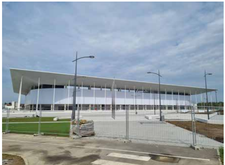
Uređivanje trga i vanjskih površina oko stadiona

iako je obloga krova trebala biti drugačija, ona izabrana nije umanjila njegovu monumentalnost. Štoviše, doprinijela je nekim novim doživljajima. Naime, gledali se prema gore, krov je zbog svoje perforirane opne poluproziran, no gledali se ravno, on ostavlja dojam punoće. Arhitektonska ideja cijeloga stadiona bila je baš ta dualnost. Paljenjem svjetla nazire se konstrukcija koju zbog veličine konzole vrijedi pokazati. Istaknuto je kako su i inženjeri statičari ponosni na to kako je riješena nosiva konstrukcija unutrašnjih stupova, krova i vanjskih, vrlo vitkih stupova. Također, nema konstrukcijskih