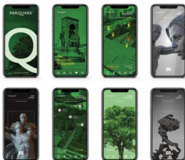
Osmišljena da poveže fizički svijet sa virtualnim, pametna aplikacija Parquare App platforma je za participativni javni život na trgu Taksim