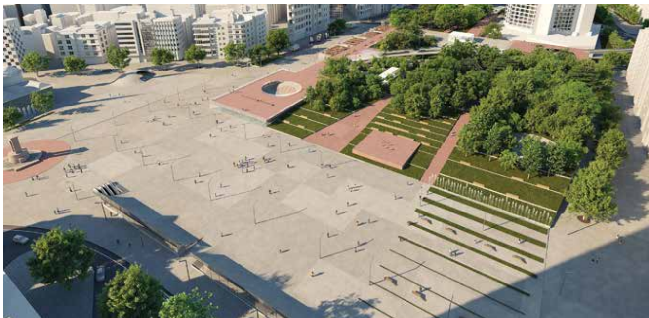
Parquarea kao nova prostorno neprekinuta cjelina s ekstenzijom zelenila na trg

Tim vrlo složenim projektom koji potpisuje mladi zagrebački, interdisciplinarni tim, postignut je zapažen iskorak na međunarodno tržište ideja, što je rezultirao doista respektabilnim plasmanom u snažnoj međunarodnoj konkurenciji (ulazak u top 20). Nažalost, nemotivirajuću poruku za buduće slične kompeticije autori nalaze u činjenici da je natječaj raspisan kao međunarodni, a na kraju su prve nagrade, a bilo ih je nekoliko, dodijeljene samo turskim timovima. Teško je znati je li to slučajnost, no jedno je sigurno: zahvaljujući multidisciplinarnome pristupu, volji, trudu i želji za učenjem s kojima se uhvatio u koštac s tim izazovnim međunarodnim projektom mladi hrvatski tim studenata i inženjera zasigurno ima velik potencijal, a njihovo vrijeme, nadamo se, tek dolazi.