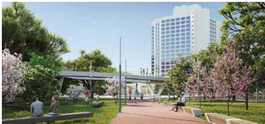
Novo rješenje Taksima kao prostor 2000 stabala, 200 puteva i 20 atrakcija

Park te drugi primjeri), no rješenje Parquarea nudi integraciju i međusobno nadopunjavanje.