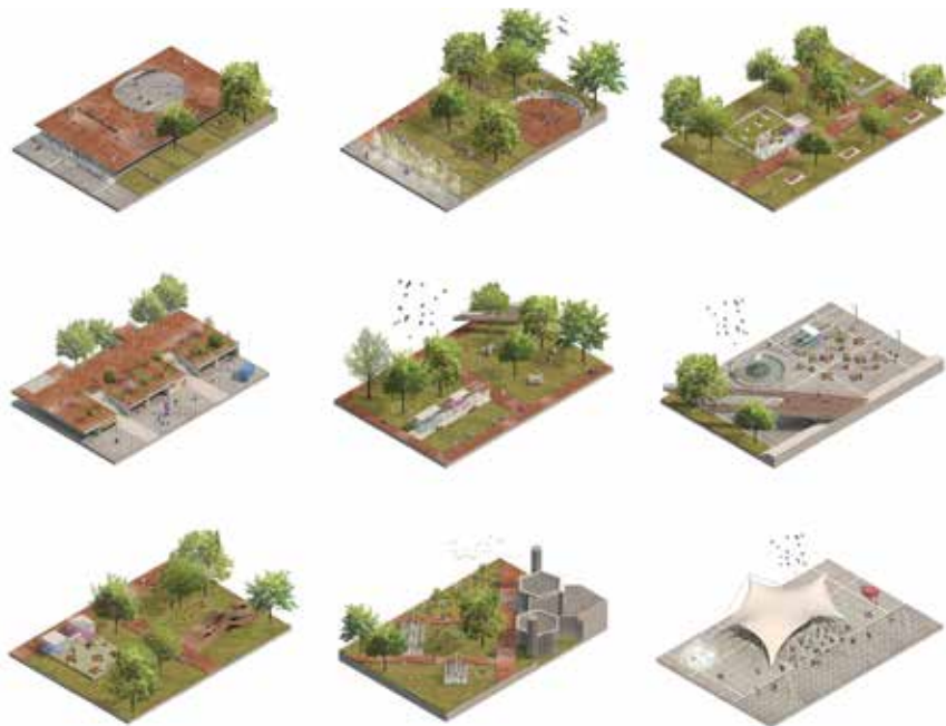
Parquarea je zamišljen kao višedimenzionalni prostor

Uz pretpostavku stvaranja Parquarea kao prostora jasnoga i usmjerenoga identiteta koji integrira park i trg potrebno je definirati strategije i taktike prostora koje mogu ponuditi principe po kojima se