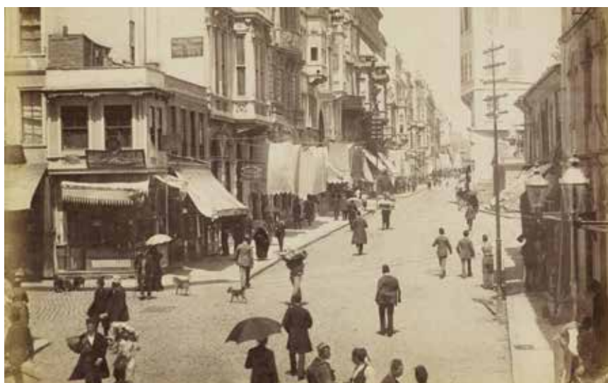
Izgled glavnog gradskog trga Taksim u Istanbulu 1880. godine

Istanbul je zasigurno jedan od najvažnijih gradova u povijesti ljudske civilizacije. Smješten na tjesnacu Bosporu koji dijeli Europu i Aziju, u gotovo 27 stoljeća postojanja promijenio je tri naziva (Bizantion, Konstantinopol, Istanbul) i bio je prijestolnica dvaju carstava (Istočnog Rimskog Carstva i Osmanskog Carstva). Grad ima ukupnu površinu od 1540 km 2 , a s 15 milijuna stanovnika najveći je europski grad te sedmi svjetski. Turski dragulj, koji oduševljava svojom kulturno-povijesnom baštinom, ljubaznim domaćinima te gradskim šušurorom, često se naziva i Drugim Rimom.