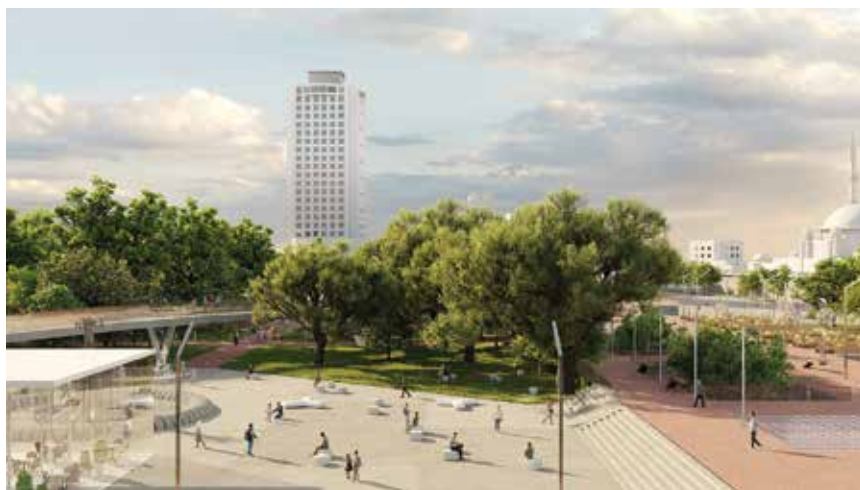
Projektno rješenje nudi integraciju gradskog trga i parka u jedinstven prostor

upravljanju gradom, postavljeno je pitanje kako bi ta gradska zona mogla biti identitetski posebna, inovativna, drugačija od ostalih trgova; koji bi to bili faktori diferencijacije globalno, ali i lokalno unutar Istanbula. Do sada su trg Taksim i Gezi Park bili tretirani kao dvije bliske, susjedne, ali odvojene površine. Imali su programski odvojene natječaje, uređenja, faze i urbanističke pristupe, dok je novo rješenje zagrebačkoga autorskog tima projektiralo jedinstveni prostor kao suživot parka i trga, brendiran kao prva urban design tipologija koja integrira oboje – park + square = Parquare . Najveći svjetski trgovi redovito imaju parkove kao odvojene izolirane zone (Trafalgar Square i Hyde Park, Times Square i NY Central