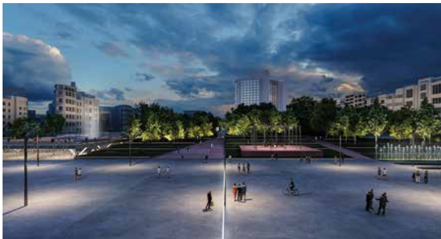
Pogled noću na novouređeni trg Taksim

fizički prostor organizira i prezentira gradu. U ovome se slučaju potezima stvara cjelina koja napokon objedinjuje prethodno fragmentiran prostor. Preko krakova mostova, pothodnika i ulica Parquare se nadovezuje na okolne zone. Definiraju se "otoci" kao prostori koji će podići razinu atraktivnosti novoga rješenja. Osim horizontalne organizacije brojnih programa provodi se i "vertikalizacija" koja ističe metropolitansku gustoću života te ozelenjivanje kako bi doista zanemarene istanbulske zelene zone napokon dobile reprezentativni zeleni krajolik integriran u gusto sagrađeno tkivo grada.