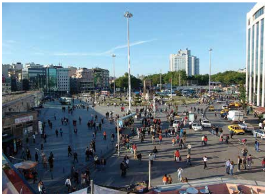
Današnji najčešći izgled trga

prilikom timovima inženjera iz cijeloga svijeta da svojim vizijama i prijedlozima pokušaju transformirati trenutačno kaotično stanje trgova Taksim i Gezi. Pozitivan pomak svakako označava i činjenica da je natječaj naslovljen kao urban design competition , što je iskorak već u nazivu onoga što se od natjecatelja očekuje. Umjesto isticanja urbanizma, arhitekture i krajobrazne arhitekture, koji se, nažalost, međusobno sve više udaljavaju, primijenjen je relativno recentan pojam koji je pedesetih godina prošloga stoljeća formiran na Harvardu kao smjer koji bi upravo sve tri spomenute grane trebao objediniti u jedan hibridni, ali složeni projektantski diskurs.