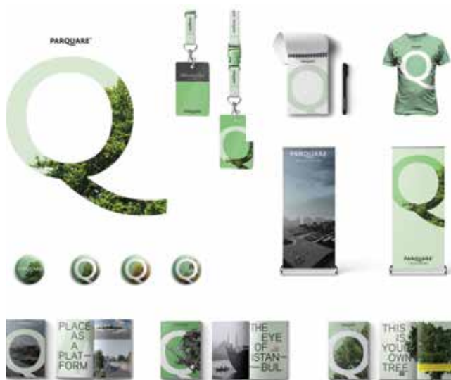
U sklopu projektnog rješenja, predviđene su kontinuirane edukativne radionice, predavanja i izložbe

Kao dio upravljanja gradom u projektu je predviđeno umjetničko djelovanje koje bi kroz Parquare podržalo viziju Istanbula kao grada umjetnosti, okupljajući domaće i međunarodne umjetnike, kulturne organizacije, obrazovne institucije, privatni sektor i društvo kroz svoj drugi identitet ParquArt . S rastom zanimanja turske javnosti za umjetnost i sve većim doprinosima privatnoga sektora u tome području razvila se velika prilika za udruživanje s ljubiteljima umjetnosti radi financiranja cjelogodišnjih aktivnosti. Kako bi trg postao svojevrsni dom kulture, dijelovi trenutne bogate umjetničke ponude u Istanbulu kao i novi projekti mogu se preraspodijeliti u središtu okruga Beyoğlu uz podršku mnogih nacionalnih i globalnih kulturnih organizacija. Osim što će umjetnost postati dio svakodnevice Parquarea kroz kontinuirane edukativne radionice, predavanja i izložbe, umjetnost će trajno biti prisutna i u podzemnim prolazima i na LED zaslonima, čineći Taksim i Gezi oplemenjujućim, kreativnim i živopisnim dijelom grada. Veliki fokus bio bi stavljen na stvaranje čvrste veze s nadolazećim naraštajima, posebno mladim umjetnicima koji bi potaknuli buduće projekte i umjetnička događanja pod motom "Mogućnosti uvođenja umjetnosti u gradski krajolik su neograničene!".