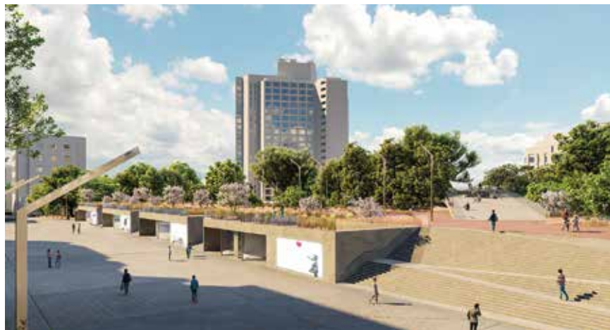
Pogled sa zapadne strane na trg Taksim

putevi, već su kaskade osmišljene kao programske zone koje omogućuju promatranje događanja bilo u parku bilo na trgu. One postaju otvorenom zonom vizualne međupovezanosti.