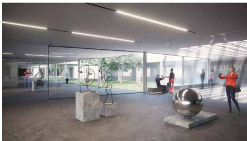
Pogled na izložbeni prostor

Prvi sloj (tzv. layer ) jesu "područja izgradnje"; zapadno od parka Gezi, uz