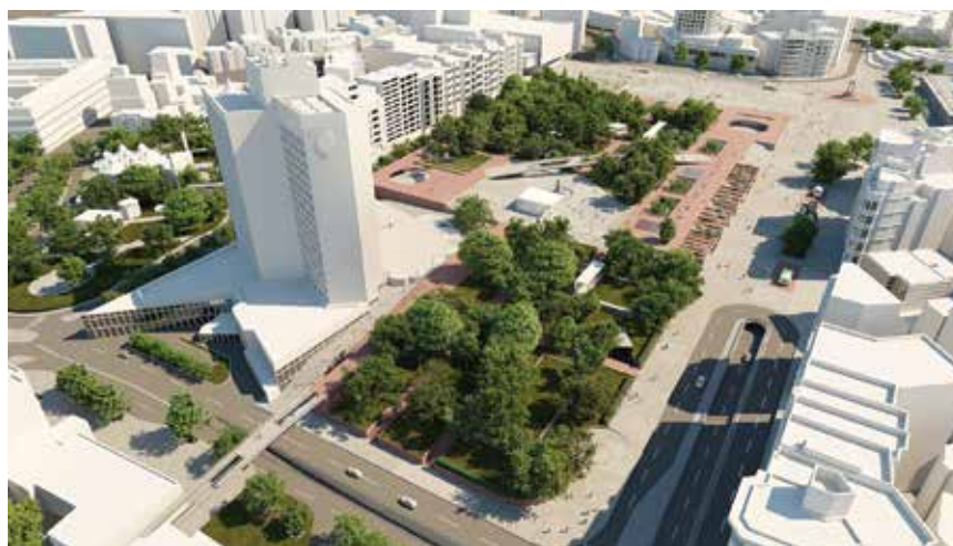
Projektno rješenje novog izgleda trga u Istanbulu