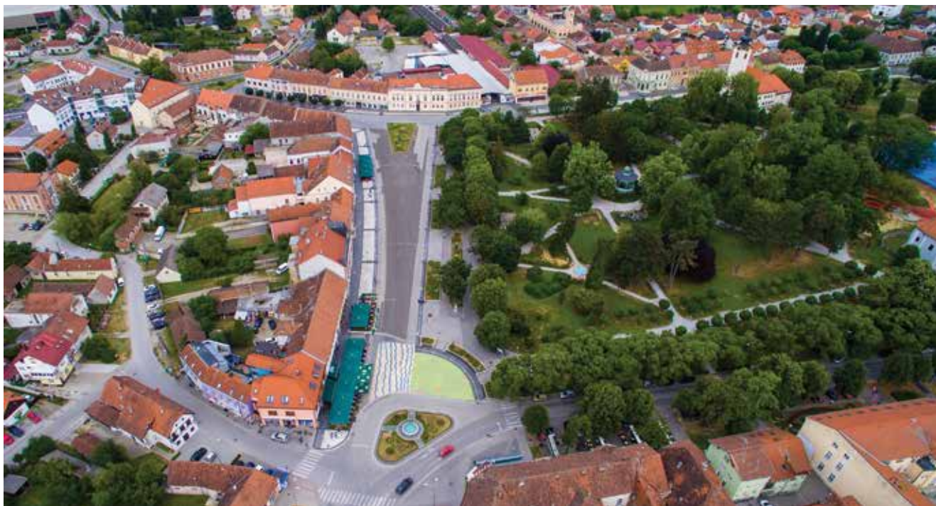
Grad Koprivnica dobitnik je nagrade u kategoriji Nabava inovacije za 2020. godinu

Grad Koprivnica vrlo je aktivan u provedbi smjernica i mjera iz Direktive o energetske učinkovitosti zgrada, Nacionalnog akcijskog plana energetske učinkovito-