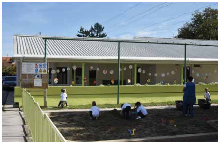
Pilot transformacija DV Tratinčica može poslužiti kao primjer dobre prakse, jer se u Hrvatskoj nalazi najmanje 25 montažnih vrtića koji trebaju opsežnu obnovu

no-obrazovnih objekata. Osim važnoga europskog priznanja Procura+Awards Grad Koprivnica je zajedno s Regionalnom energetske agencijom Sjever 2019. za radove na istome vrtiću dobio i godišnju nagradu za zelenu gradnju i održivi razvoj u kategoriji "Građevina godine – rekonstrukcija", koju im je dodijelio Hrvatski sa-