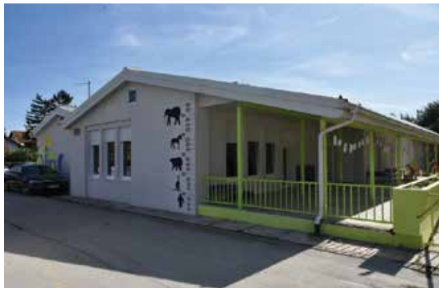
Pogled na zgradu nakon temeljite obnove