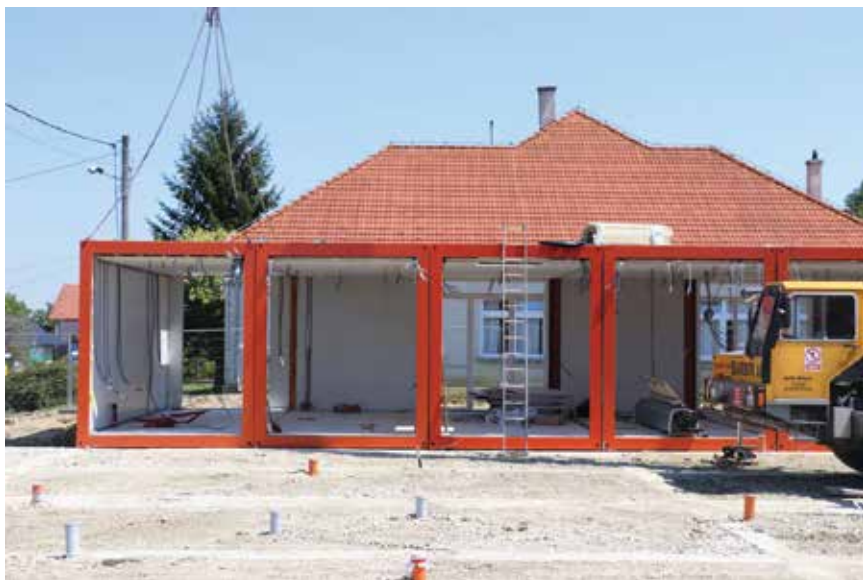
Radovi na izgradnji novog vrtića u Starigradu pokraj Koprivnice

Ugovoreni izvođač na temelju zahtjeva iz postupka nabave ponudio je i izveo nekoliko efektivnih rješenja kojima su za približno 500 eura po kvadratnom metru u cijelosti revitalizirani unutrašnjost vrtića Tratinčica , sanitarni čvorovi i dječje sobe te je zgrada u cijelosti energetske obnovljena. Takav pristup još nije bio primijenjen u Hrvatskoj, a rezultati toga projekta drugim gradovima mogu poslužiti kao primjer kako se učinkovito uhvatiti ukoštac s obnovom zastarjelih odgoj-