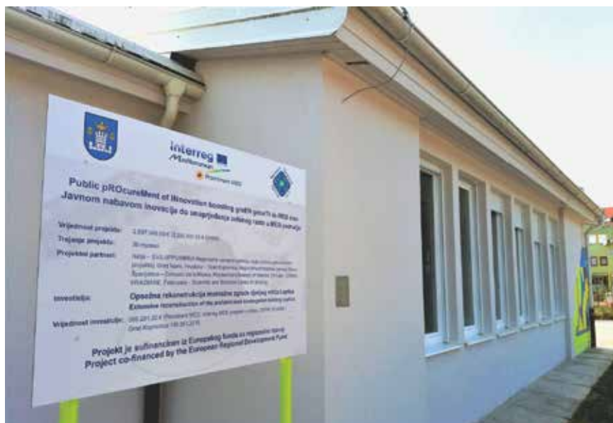
U sklopu EU-ov projekta Prominent MED provode se projekti cjelovite obnove zgrada u četiri partnerske zemlje

sti, Akcijskog plana energetske održivosti razvika i ostalih strateških dokumenata. Cilj gradskog programa pod nazivom "Novo lice Koprivnice" jest učvrstiti načela održivoga razvoja u svim područjima urbanoga planiranja i korištenja zemljišta. Program predviđa izgradnju i obnovu javnih zgrada radi postizanja ciljeva energetske učinkovitosti EU 2020. U sklopu tog programa Grad je u suradnji s Regionalnom energetske agencijom Sjever (REA Sjever) krajem 2016. počeo provoditi međunarodni EU-ov projekt Prominent MED, čija je svrha provesti projekte cjelovite obnove zgrada u četiri partnerske zemlje, odnosno u Hrvatskoj, Italiji, Portugalu i Španjolskoj, koristeći relativno novoga postupka javne nabave inovacija. U Hrvatskoj je projekt proveden u suradnji s Dječjim vrtićem Tratinčica . Stručnu podršku postupku i pilot-projektu dali su nacionalni i međunarodni stručnjaci za nabavu i tehnički stručnjaci.