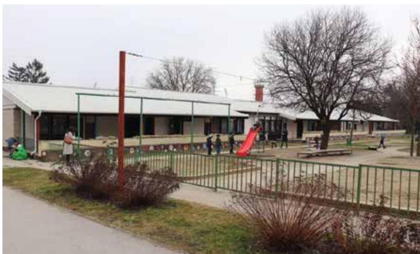
Dječji vrtić Tratinčica prije obnove

brazbu predškolske djece od godinu dana do polaska u školu. Njegov osnivač i vlasnik jest Grad Koprivnica. Vrtić radi svakoga radnog dana, osim u srpnju i kolovozu, a u njemu je zaposleno 20 osoba. Zgrada je sagrađena 1982. kao montažna drvena prizemnica s čvrstim temeljima (75 posto ukupne površine). Godine 1995. dograđen je zidani aneks s čvrstim temeljima (25 posto ukupne površine). Zgrada je izduženoga oblika, a na južnoj strani nalaze se terase. Prije obnove u starome montažnom vrtiću propuštale su cijevi vodovodnoga sustava, zbog čega su neki pregradni zidovi bili u stanju raspadanja. Vlažan prostor, stara stolarija i poteškoće s kanalizacijom bile su, nažalost, ne baš lijepa svakodnevni- ca u funkcioniranju te odgojne ustanove. Koncept unutarnjega prostora zastario je. Središnji hodnik bio je uzak, pretrpan garderobnim ormarićima i teško prohodan. Zbog neprozirnih pregradnih zidova dječje skupine bile su odvojene i nije postojala mogućnost udaljenoga nadgledanja djece. Dnevno svjetlo teško je dopiralo u dječje sobe i hodnik, a nije postojao ni sustav hlađenja ili ventilacije. Prije objave natječaja investitor je uz pomoć tehničkih stručnjaka proveo detaljne preglede zgrade vrtića te proveo konstrukcijska ispitivanja. Pokazalo se to da je zgrada pogodna za radove unutarnje i vanjske transformacije. Pilot-projekt nije se odnosio samo na energetske obnovu građevine, nego je