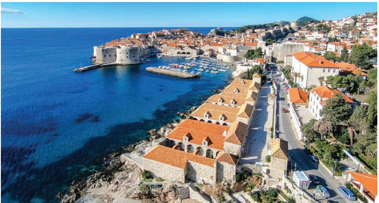
Pogled na Lazarete i stragu gradsku jezgru Dubrovnika

Kako bi se spriječio prijenos smrtonosne bolesti, upravo je u Dubrovniku donesena prva odluka o utemeljenju karantene u povijesti europskoga zdravstva. Lazareti su izgrađeni kao jedna od preventivnih zdravstvenih mjera zaštite stanovnika u Dubrovačkoj Republici. Budući da je ta važna luka primala putnike iz svih krajeva svijeta, Veliko vijeće Dubrovačke Republike je 27. srpnja 1377. donijelo odluku kojom je prvi put u svijetu uvedena karantena kao mjera zaštite od unošenja i širenja zaraznih bolesti, ponajprije kuge. Ta je odluka objavljena u tzv. Zelenoj knjizi pod naslovom "Tko dolazi iz okuženih krajeva, neka ne stupi u Dubrovnik ni na njegovo područje" (prevedeno s latinskoga jezika). U odluci je propisano to da ni