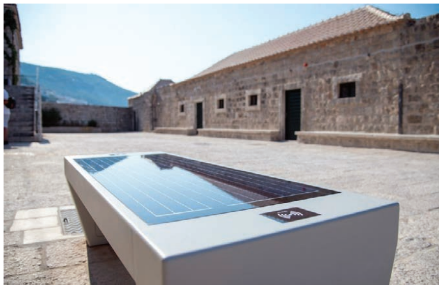
U sklopu projekta instalirane su i tzv. pametne klupe