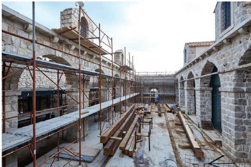
Pogled na gradilište

Dubrovnik želi postati prepoznatljivo kulturno-povijesno odredište tijekom cijele godine, čime bi se trebali stvoriti temelji za provedbu integriranoga razvojnog programa cijeloga turističkog odredišta. Projekt je osmišljen kroz jedanaest kom-