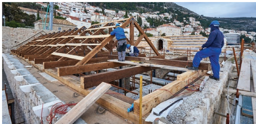
Obnova posljednje tri lađe Lazareta