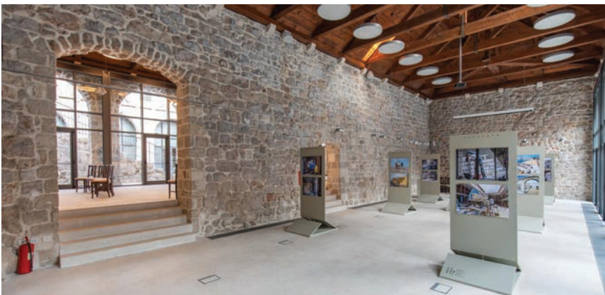
Pogled na izložbeni prostor u Lazaretima

što je projekt sufinanciran sredstvima Europske unije. Povlačenje europskih sredstava bio je neophodan korak za Dubrovnik jer EU daje dodatnu vrijednost obnovi i promidžbi kulturne baštine. Ministrica Obuljen-Koržinek istaknula je to kako Dubrovnik potvrđuje to da Grad uz pomoć Vlade ima snagu obnoviti takve reprezentativne baštinske prostore i staviti ih u funkciju ponajprije svojih građana te to kako su udruge koje će se smjestiti u Lazaretima ključne za kulturni život grada tijekom cijele godine.