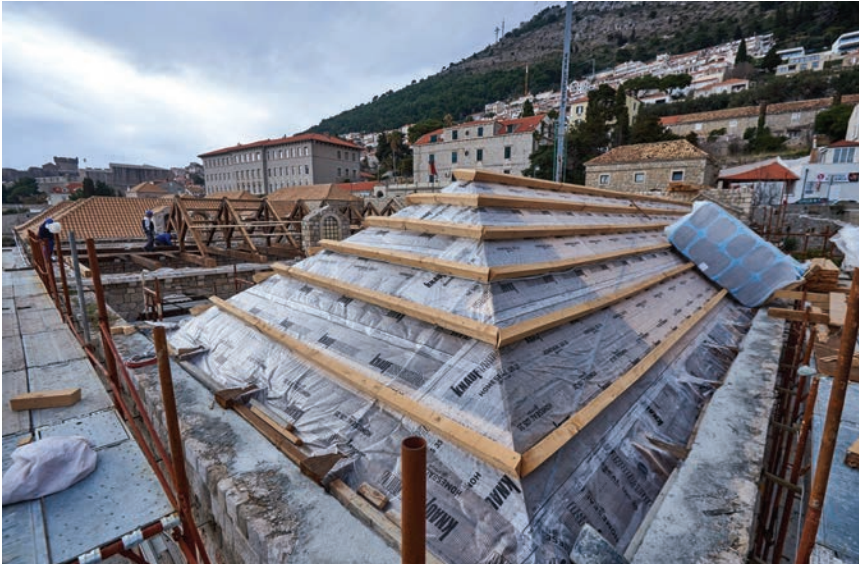
Postavljanje toplinske izolacije