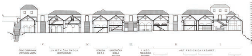
Poprečni presjek povijesnog kompleksa Lazareta

domaći ljudi, ni stranci koji stižu iz kužnih krajeva ne mogu ući u grad ako prethodno ne borave 30 dana na otocima Mrkanu, Bobari i Supetru pored Cavtata. Zbog udaljenosti, ali i iz strateških razloga, karantena je premještena bliže Dubrovniku, a početkom 15. stoljeća izgrađen je lazaret na Dančama. Dobra organizacija toga lazareta omogućila je potpuno ukidanje karantene na otocima pokraj Cavtata. Zbog velikoga porasta opsega dubrovačke trgovine u 16. stoljeću kapacitet lazareta na Dančama postao je premalen, pa je dubrovačka vlada 1534. odlučila sagraditi veću karantensku građevinu na otoku Lokrumu, koja iz strateških razloga nikada nije dovršena. Nakon toga problem karantene još dugo nije bio riješen. Krajem 16. stoljeća razmišljalo se o izgradnji lazareta na Pločama, no radovi na provedbi toga projekta započeli su tek 1627. i trajali do 1647. godine. Sklop Lazareta sastojao se od pet istovjetno organiziranih odjela, među kojima su tri istočna nešto duža