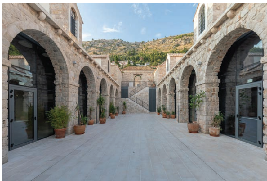
Pogled na dvorište između dva lazareta

Karantena (lazareti) u starome Dubrovniku bila je ponajprije institucija, a ne građevina, premda je sklop zgrada na Pločama danas postao njezin sinonim. Lazareti su bili u nadležnosti Zdravstvenoga magistrata sastavljenog od petorice vlastelina (tal. Officiali alla Sanità ) koji su propisivali praktične mjere protiv širenja zaraznih bolesti. Upravljanje Lazaretima bilo je povjerenjeno kapetanu Lazareta i njegovu zamjeniku, koji su za trajanja mandata ondje morali stanovati zajedno s pomoćnim osobljem. S obzirom na iznimnu gospodarsku i stratešku važnost Lazareta za Dubrovnik, sklop je tijekom Dubrovačke Republike bio dobro i redovito održavan državnim sredstvima, a posljednji veći građevinski zahvat na njemu izveden je 1784. Lazareti su, uz kratkotrajni prekid tijekom francuske okupacije, zadržali funkciju i za austrijske vlasti, a prema arhivskim spisima, čini se da su ukinuti oko 1872. godine.