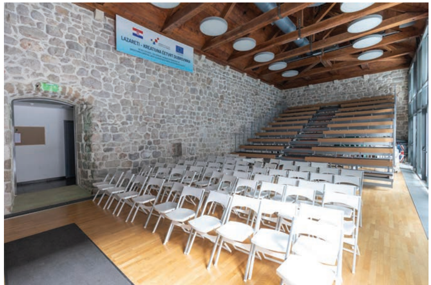
Pogled na obnovljeni amfiteatar

U sklopu završne konferencije projekta "Lazareti – kreativna četvrt Dubrovnika", održanoj 28. srpnja 2019., bilo je organizirano svečano otvorenje obnovljenoga povijesnog kompleksa. Na svečanosti su bili Andrej Plenković, predsjednik Vlade RH, Nina Obuljen-Koržinek, ministrica kulture, i Marko Pavić, ministar regionalnoga razvoja i fondova Europske unije. Predsjednik Vlade Plenković tom je prilikom istaknuo to kako će obnovljeni Lazareti upotpuniti kreativni dio ukupne bogate kulturne ponude Dubrovnika, ali i dati novu dimenziju brojnim udrugama koje djeluju u izvrsno opremljenim prostorima. Izrazio je zadovoljstvo time