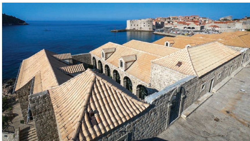
Pogled na Dubrovačke Lazarete