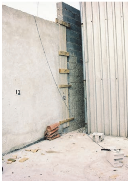
Slika 5. Oplata sa jedne i druge strane betonskog zida

Rad se odvijao na način da je nakon što je postavljena oplata s obje strane zida