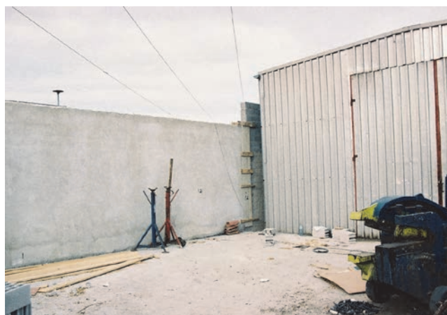
Slika 3. Betonski zid na gradilištu u blizini vodiča dalekovoda

Pošujući pravila struke, a u slučaju rada na električnim postrojenjima i instalacijama to su zaštitne mjere poznate kao "pet zlatnih pravila" za osiguranje mjesta rada te uzimajući u obzir upute za rad i sve mjere zaštite na radu uz uporabu zaštitnih sredstava i osobnu zaštitnu opre-