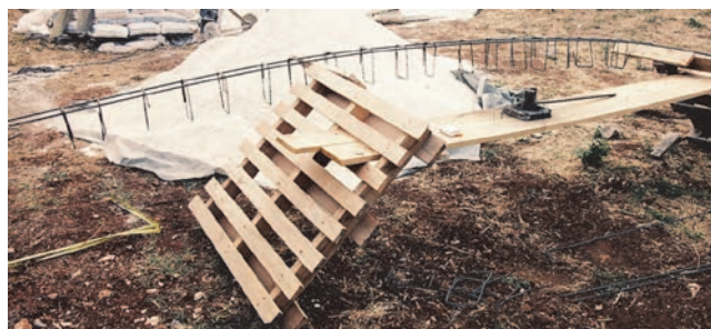
Slika 4. Čelična armatura pripremljena za ulaganje u oplatu betonskog zida