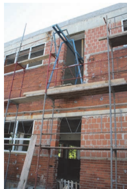
Slika 2. Nosač dizalice na gradilištu

Nesreća na radu dogodila se prilikom rukovanja građevinskom dizalicom u krugu gradilišta industrijskog objekta, slika 2. Do nesreće je došlo prilikom podizanja građevnog materijala na gornju etažu objekta, na način da se nastradali radnik stojeći na metalnoj skeli popođenoj daskama rukom uhvatio za metalnu cijev nosača na kojemu je stajala dizalica, te je u tom trenutku došlo do strujnog udara.