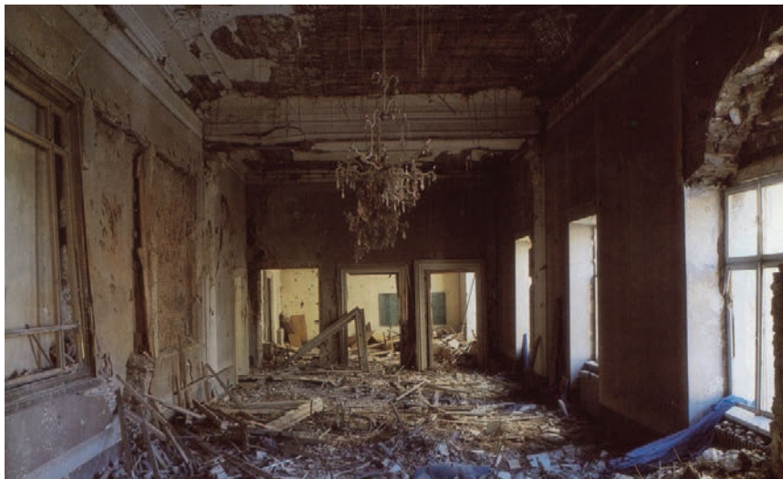
Razaranje Kneževe palače u Domovinske ratu; Arif Ključanin, 1991.

Kneževa palača u Zadru jest nepokretno (pojedinačno) kulturno dobro upisano u Registar kulturnih dobara pod brojem Z-7106 kao kompleks Namjesništva (bivše Providurove i Kneževe palače). Povijesni izvori bilježe ju još u 13. stoljeću. Zidne strukture pokazuju roma-