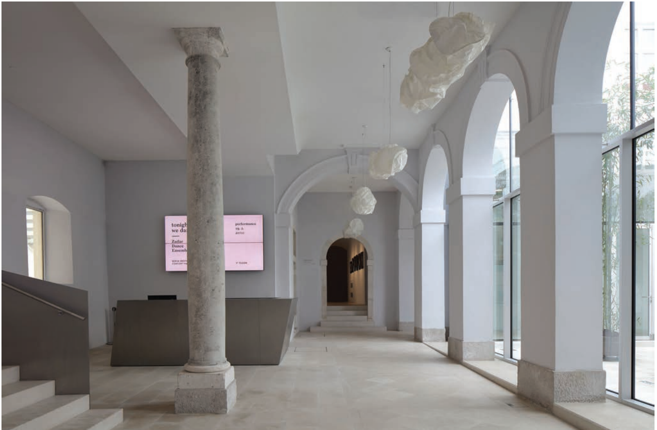
Pretprostor s infopultom; Jasenko Rasol, 2016.

sastajališta/okupljališta. Zbog svoje središnje i ulazne orijentacije (povezanost s ophodom u prizemlju, pristup svim glavnim pravcima kretanja kroz objekt) atrij je u funkciji predprostora drugih sadržaja u Kneževoj palači te odredište i prostor za događanja. Događanja u atriju mogu se svesti na nekoliko tipova koji zahtijevaju organizaciju vlastitih prostornih konfiguracija: