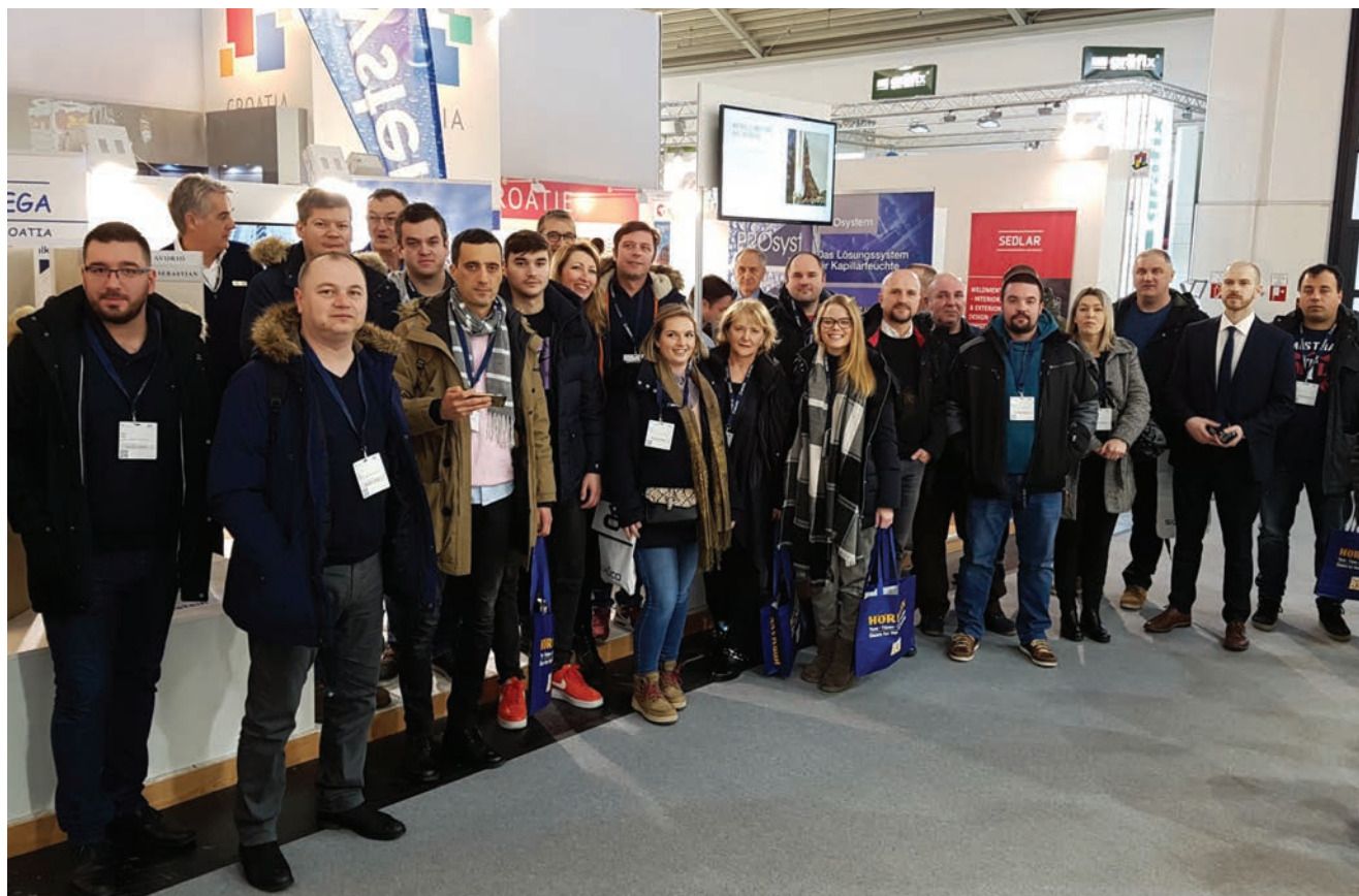
Posjetitelji ispred izložbenog prostora Hrvatske gospodarske komore

Ondje su odabrane startup tvrtke predstavile svoje proizvode i poslovne ideje. Zamjenik predsjednika Uprave sajma BAU Reinhard Pfeiffer vrlo je zadovoljan uspjehom sajma. Veliko zanimanje posjetitelja za automatizaciju zgrada i BAU IT pokazuje to da se cijelo područje digitalizacije povećava i da se konačno uključuje u građevinski sektor. Digitalizacija u građevinarstvu dobila je zamah i konačno postaje standard. Tom su prigodom organizatori najavili sajam digitalBAU koji će se održavati svake dvije godine u gradu Kölnu. Prvi digitalBAU održat će se od 11. do 13. siječnja 2020.