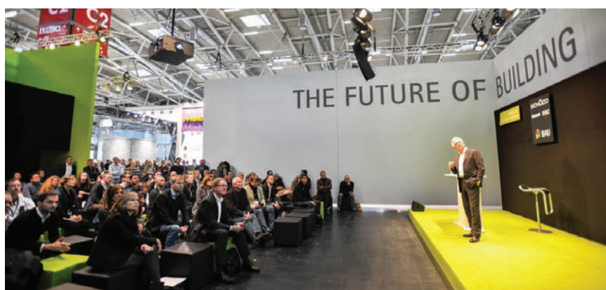
Detalj s jednog od brojnih predavanja održanih za vrijeme sajma

Među stranim posjetiteljima na sajmu najviše je bilo Austrijanaca, Švicaraca i Talijana, a zabilježen je znatan porast broja posjetitelja iz Rusije (više od 4000; u odnosu na 2017. kada ih je bilo oko 2000) i Kine (više od 3500; u odnosu na 2017.