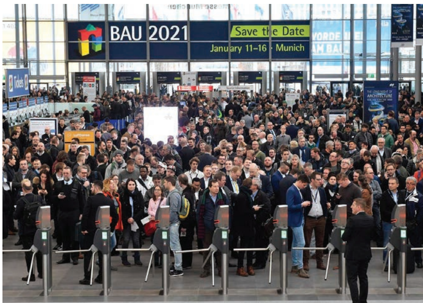
Gužva na ulazu u izložbeni prostor

Najveća gužva vladala je u Digitalnome selu (engl. Digital Village ), u hali C5, u kojemu je moto glasilo "Povezujemo, maksimaliziramo, nadahnjujemo", a koje je prvi put u povijesti povezalo digitalne inicijative u građevinskoj industriji s aktualnim zbivanjima u softverskoj industriji.