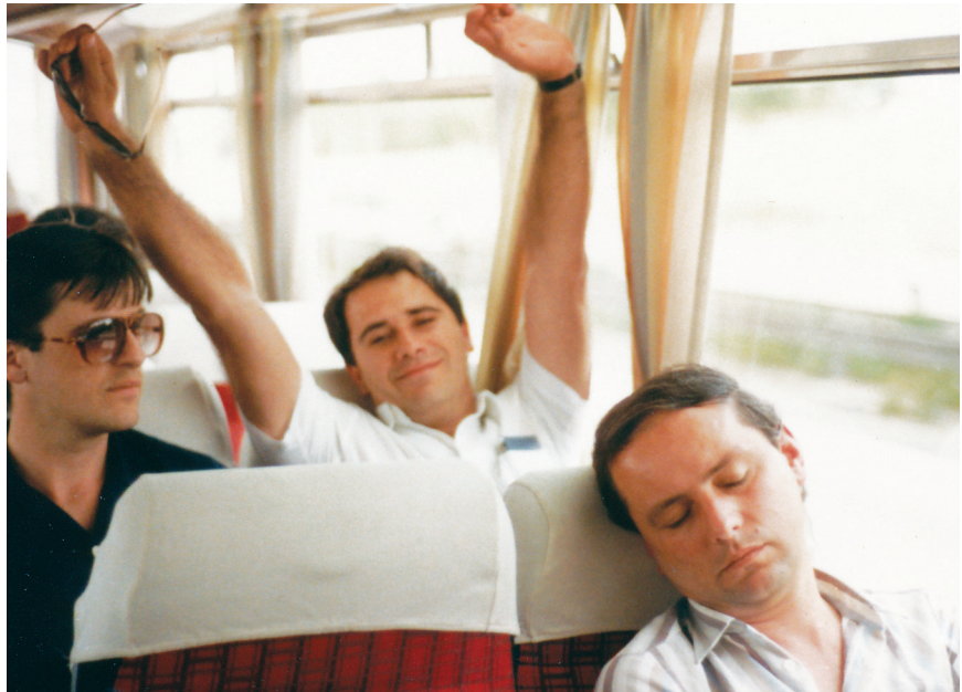
Uspomena na jedno zajedničko putovanje zaposlenika Hidroprojekta

Prije odlaska u mirovinu trebalo mu je pola godine da dovrši sve poslove. Rekli smo već da često boravi u Vinkovcima, ali sada jednostavno koristi priliku da tamo može boraviti puno dulje nego što