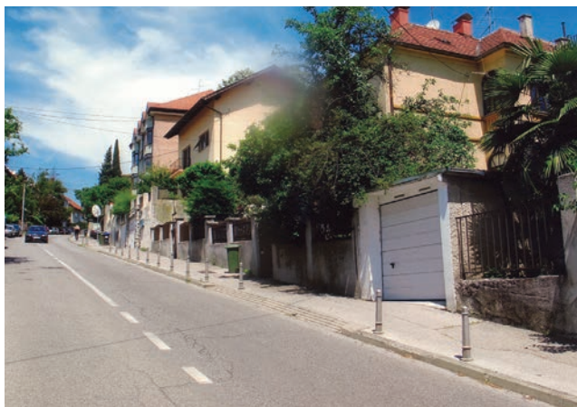
Niz obiteljskih vila u zagrebačkoj ulici Horvatovac

Odlazak starijih osoba u staračke domove ograničen je brojem mjesta i platežnim mogućnostima, a i nastoji se dao nešto je moguće dulje ostaju u vlastitome domu jer im je tamo sve poznato i blisko. To je samo svojevrsno upozorenje projektantima i investitorima da u gradnji ne misle samo na danas već i na sutra. Iz navedenoga je vidljivo da dosadašnji tip gradnje obiteljskih zgrada nije najprimjereniji. Posebnu pažnju treba posvetiti rasporedu prostorija te svakako predvidjeti i osigurati mogućnost ugradnje osobnih dizala.