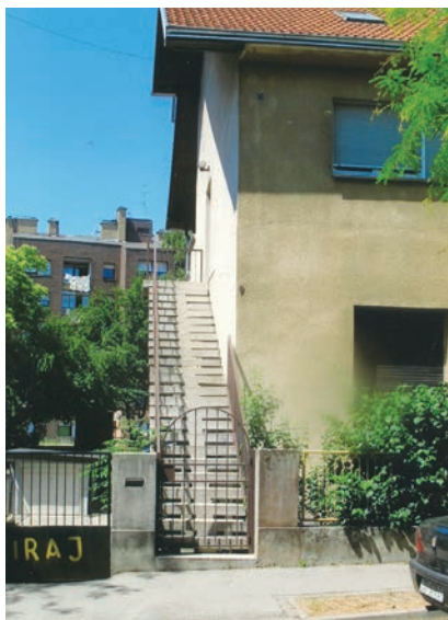
Stubište izvedeno u jednoj obiteljskoj zgradi u Babonićevoj ulici

Zbog razvoja trgovine, industrije, školstva i sličnog u Zagrebu je nakon Prvoga svjetskog rata znatno bila povećana potreba za stambenim prostorom. Grad je u tu svrhu parcelirao određene prazne prostore i omogućio gradnju obiteljskih vila na brojnim povišenim predjelima Josipovca, Šalate, Horvatovca i drugih dijelova grada. Takvi su bili i lokaliteti po bregovitim sjevernim prostorima iznad Vlaške i Maksimirske. Banke su davale povoljnije zajmove pa su mnogobrojni ondašnji gradski činovnici gradili samostojeće obiteljske vile, uglavnom katnice i nešto manje dvokatnice. Vile su projektirali mnogi poznati zagrebački arhitekti, među kojima je svakako najpoznatiji Stjepan Planić (1900. – 1980.), autor stambeno-poslovne zgrade Napretka u Zagrebu i Tomislavova doma na Sljemenu. Ti su projektanti stvorili poseban tip obiteljskih zgrada koje su imale podrum u kojemu su se nalazili spremište za ogrjev, praonica ( vešernica ) i ostava za namirnice, a na katu su obično bile spavaonice, balkoni, kupaonica i drugo. Prizemlje, povišeno ili u razizemlju, imalo je veliku sobu za dnevni boravak s trpezarijom za okupljanje obitelji i prijatelja, kuhinju, malu ostavu (špajzicer), sanitarne