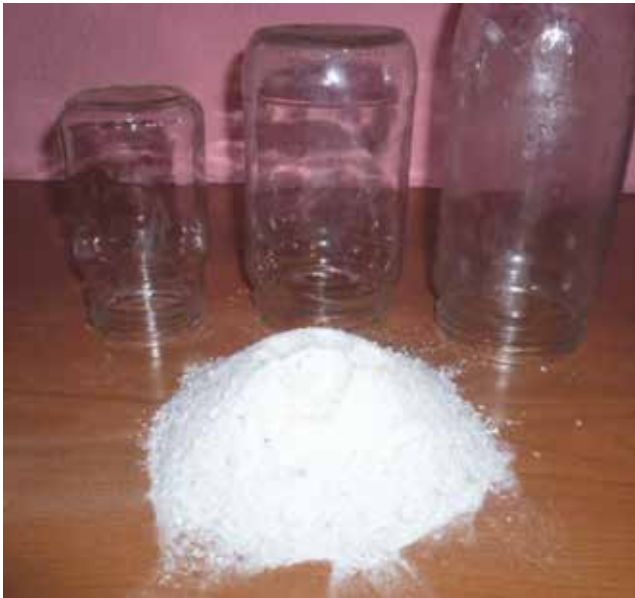
Slika 2. Otpadno staklo kao zamjena za dio kamenog brašna [25]

[23] u 2011. godini. Udio recikliranja za pojedine zemlje EU-a doseže značajnih 60 %, što je mnogo više u odnosu na Republiku Hrvatsku gdje je tijekom 2012. godine prikupljeno i separirano 33 747 t otpadnog stakla [24]. Na slici 2. prikazano je ručno drobljeno otpadno staklo koje je upotrijebljeno kao zamjena za dio punila u provedenom ispitivanju [25].