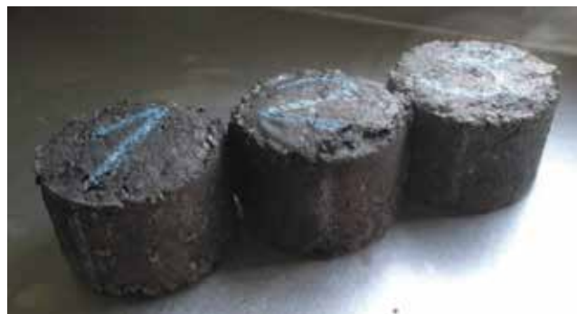
Slika 3. Asfaltni uzorci sa 6,2 % udjela letećeg pepela [37]

čestica svih vrsta punila je do najviše 0,075 mm i punilo je uvijek sadržavalo samo jednu vrstu materijala. Za sve vrste otpadnog materijala kombinirani su omjeri 100 % čestica veličine do 0,075 mm; 100 % čestica veličine do 0,02 mm te s 50 % čestica do 0,02 mm i 50 % čestica od 0,02 mm do 0,075 mm. Opaženo je da različite vrste otpada pri svim omjerima djeluju različito na zamor materijala, ali i da je za sve vrste otpadnog materijala najveći modul elastičnosti postignut kod omjera 50/50, pri čemu je mješavina kod koje je punilo od keramičke prašine postigla najbolji modul elastičnosti. Mješavina s punilom od čeličanske zgure pokazala je najmanju otpornost na zamor.