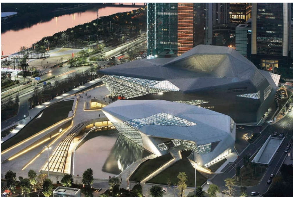
Zgrada opere u Guangzhou - Guangzhou Opera House

sjeverne planine i priroda. Projekt na Srđu od početka je bio izvor sukoba onih koji su mislili da se radi o devastaciji te onih koji su projekt podržavali i smatrali da će Dubrovnik od njega imati višestruku korist. Od projekta se odustajalo nekoliko puta zbog neprestane svađe pristaša i protivnika projekta, međutim, bez obzira na optužbe, neupitno je da je koncept vila kakve je zamislila Zaha Hadid nešto inovativno i moderno. Pitanje je odgovara li on lokaciji i naslijeđu jer Zaha Hadid nikada nije bila u Dubrovniku i one bi se mogle izgraditi bilo gdje u svijetu.