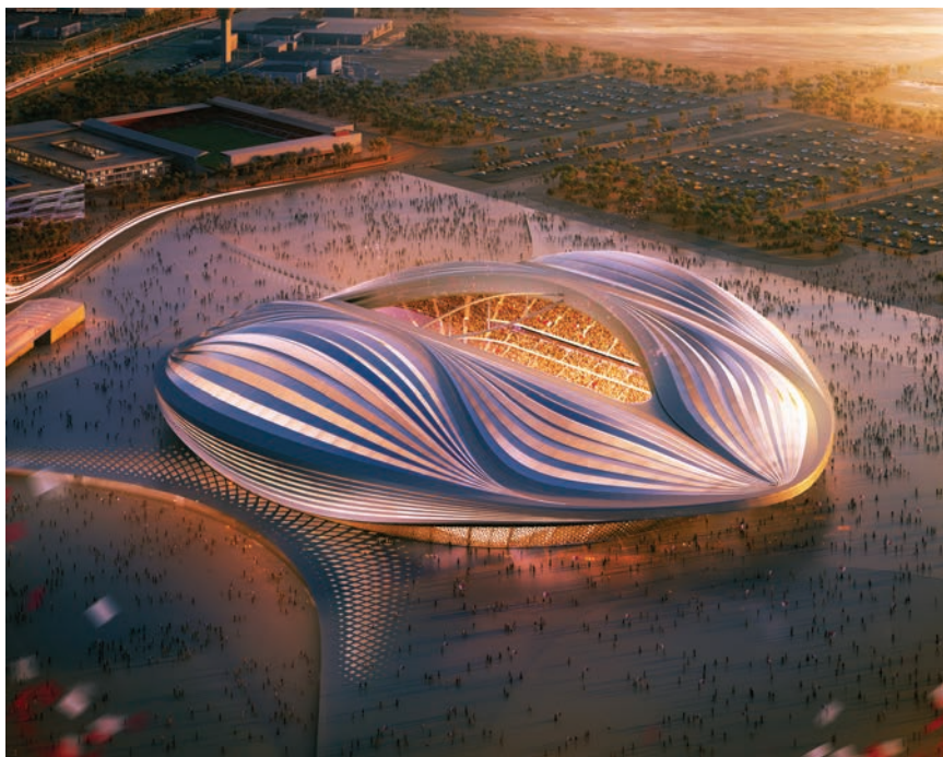
Projekt za stadion u Kataru

strad PCW 9512. U posljednjih nekoliko godina ona i njezina desna ruka Patrik Schumacher do maksimuma su iskorištavali sposobnost naprednog softvera da zamisle i opišu oblike izvan dosega ljudskog uma i ruku.