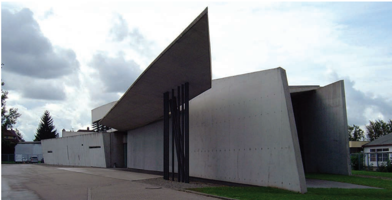
Jedan od prvih projekata - Vitra fire station

htio zamijeniti prepune naseljene ulice prostranstvima zelenila.