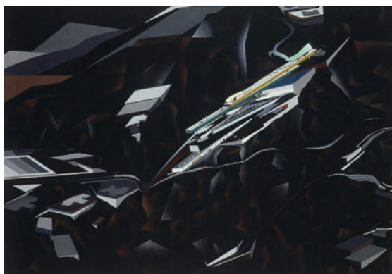
Crteži projekta Peak