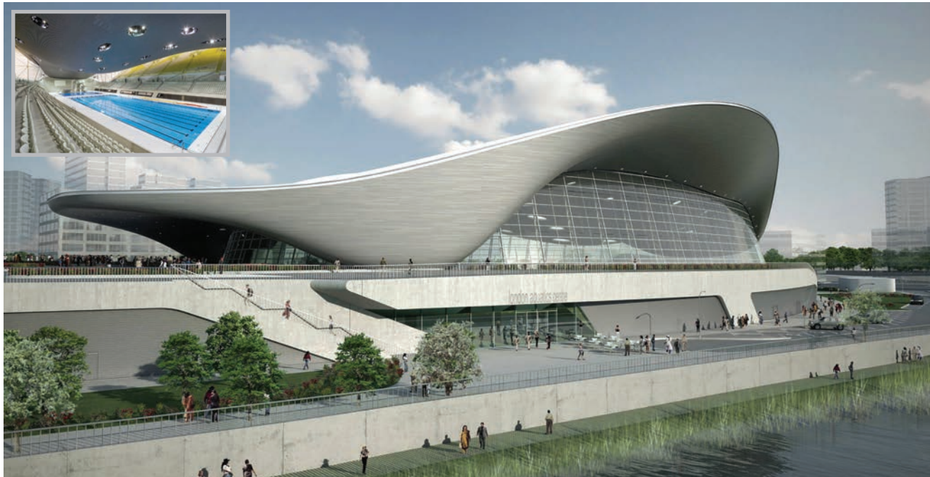
Londonski centar za sportove na vodi London Aquatics Center

ciju koja se savija i vrtoglavo naginje, a ujedno je stvorila prepoznatljiv stil Zaha Hadid.