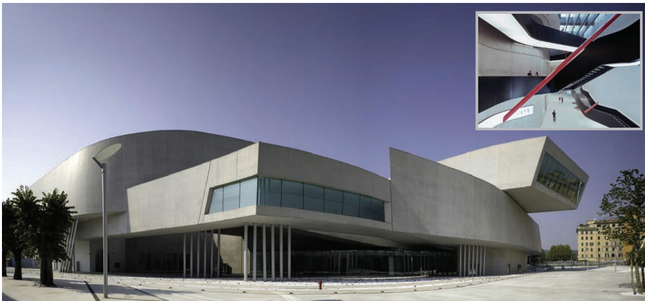
MAXXI talijanski nacionalni muzej, Rim

Prvi veliki izvedeni Hadidin projekt bio je Vitra Fire Station u Weilu na Rajni, u Njemačkoj. Vatrogasna je postaja završena 1993. Imala je betonsku konstruk-