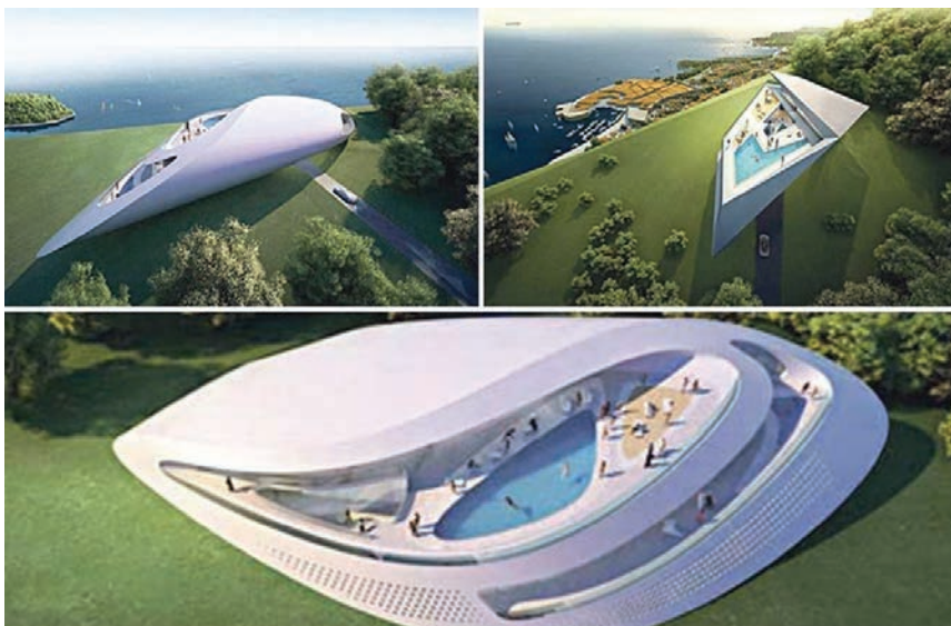
Projekt za dvije vile na Srđu - Rock i Shell

Arhitekt i arhitektonski učitelj Peter Cook rekao je prilikom dodjele kraljevske zlatne medalje za arhitekturu da je Hadidin rad zasigurno poseban. Čitavog se radnog vijeka upuštala u projekte u koje bi se malo tko usudio. Ako je Paul Klee poveo liniju u šetnju, Zaha je povećala površine koje su tjerane tom linijom u virtualni ples, spretno ih presavila i odvela na put u svemir. Oni dovoljno sretni koji su vidjeli Heydar Aliyev centar u Bakuu uživo sigurno nikada nisu bili u takvome bajkovitom prostoru s ogromnom unutarnjom rampom i osvjetljenjem koji uvelike odudaraju od tzv. normalne arhitekture koju smo dosada