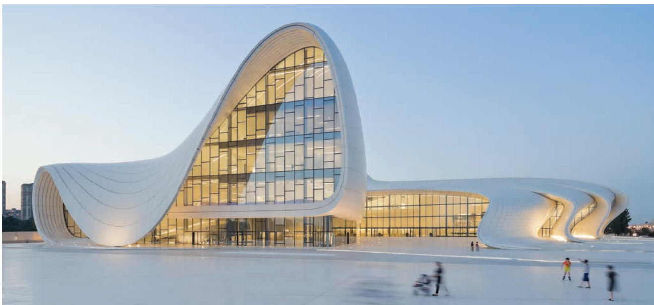
Azerbejdžanski centar Heydar Aliyev Centre

Azerbejdžanski centar Heydar Aliyev Centre jedan je od najboljih Hadidinih radova. Gracioznim krivuljama koje kao da se pomiču namjeravala je ponuditi nešto novo u odnosu na prepoznatljivu sovjetsku arhitekturu. Rezultat je veličanstven. Međutim, projekt je bio ugrožen kritikama na račun toga što centar nosi ime Hejdara Alijeva, bivšeg autoritarnog lidera u zemlji. Osim toga, iz-