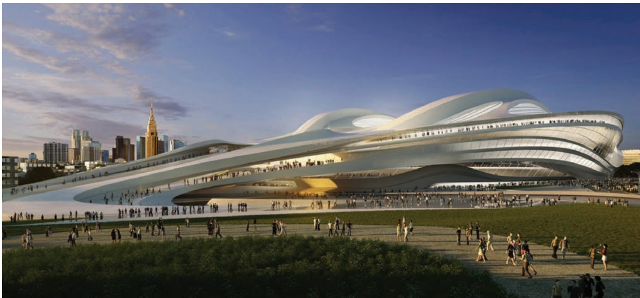
Projekt za olimpijski stadion u Tokiju koji je pokrenuo veliku raspravu

brinula za druge ljude i njihove obitelji. Djeca su je nevjerojatno voljela. Imala je golem interes za svijet izvan arhitekture, i zapanjujući intelekt i pamćenje.