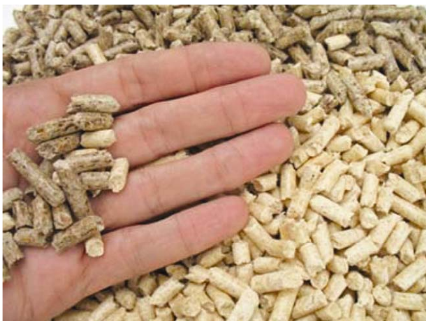
Tipičan otpad iz obrade drva

Gospodarenje otpadom potiče različite načine obrade drvnog otpada, i pepela kao njegova ostatka nakon