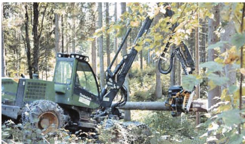
Suvremena sječa šume u Sloveniji

pri forsiranoj karbonizaciji pretežno je uzrokovana vezivanjem ugljičnog dioksida i vode (vlažan plin). Često drveni pepeo prekoračuje sadržaj do 3 posto ukupnoga organskog ugljika. U tom slučaju o odlaganju, uz pH vrijednost, odlučuje sadržaj otopljenoga organskog ugljika. Ako mu je vrijednost dovoljno niska (ispod 80 mg/l), tada se pepeo može odlagati na odlagalište.