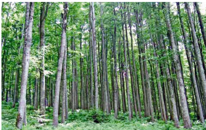
Jedna kultivirana šuma u Sloveniji

Biomasa je glavni proizvod bioloških procesa u biosferi, od čega jedan