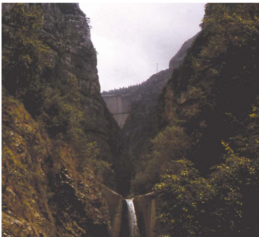
Betonska brana Vaiont zamišljena kao tada najviša u svijetu, gotovo 50 godina stoji kao spomenik ljudskim greškama

Dvadesetak godina kasnije ponovno sam otišao u Longarone i vidio pos-