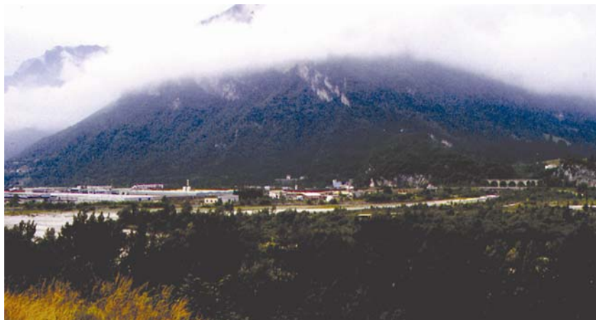
Obnovljeni gradić Longarone dvadesetak godina nakon katastrofe

ve drugu, ugodniju sliku. Izgrađene su nove zgrade, obnovljeni mostovi i prometnice, izraslo drveće, ljudi okolo i sve živo kao da nesreće nije ni bilo. Iz priloženih se slika vidi novi gradić Longarone te "mrtvi kapital" brana daleko iza, u tjesnacu gorja Toc.