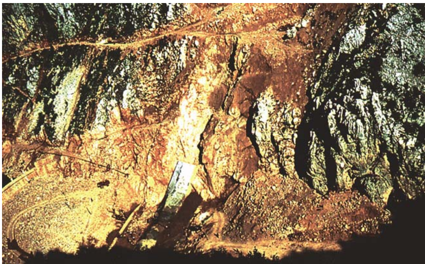
Pogled na branu „Sklope“ u prvoj fazi gradnje

Osvrnimo se na samu katastrofu, na noć 9. listopada 1963. kada je masa zemlje natopljena vodom iz akumulacije te kišom skliznula s okolnoga gorja Toc u akumulaciju. Žitka masa i kamenje survali su se u jezero te naglo podigli razinu vode do iznad krune betonske brane. Vodeni se val spustio kroz uski planinski tjesnac odnoseći sve pred sobom velikom brzinom. Vremena za bijeg te spašavanje nije bilo, pa je to bio pravi pomor ljudi i domaćih životinja. Priča da su trupla doplutila do Venecije ne stoji jer su i stari i novi uljev