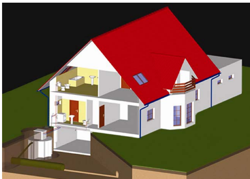
Kuća kod koje je spremnik kišnice izvan kuće, ukopan u zemlji

U odabiru materijala te izvedbi cijevi potrebno je razmotriti valjane tehničke propise odvodnje oborinskih voda s građevina i tla. U obzir se