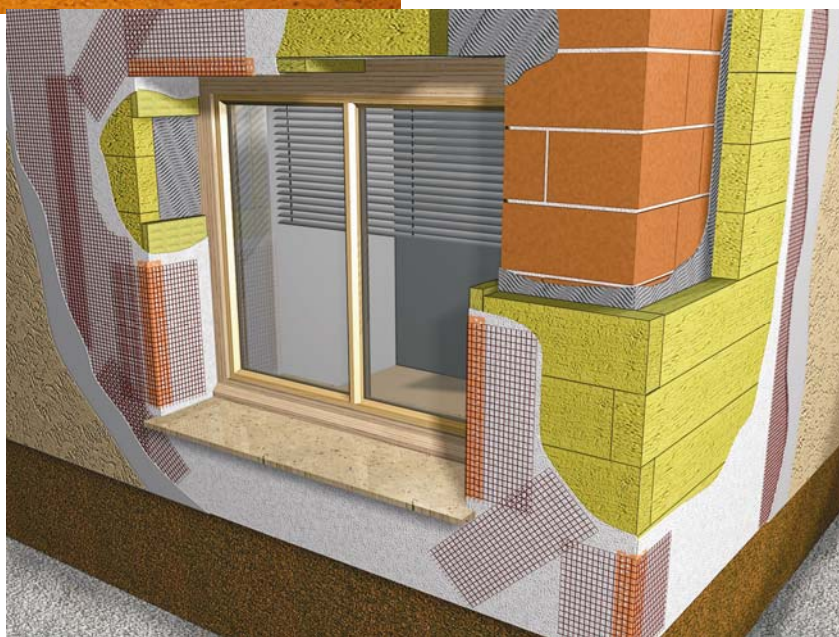
Postupak ugradnje mineralne vune

Drugi je tip toplinskoizolacijskog materijala koji se često primjenjuje