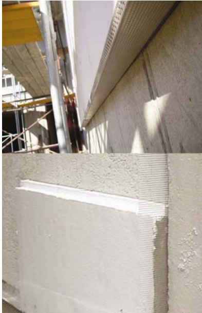
Izolacija zida od stirodura

ekspandirani polistiren, poznatiji kao stiropor ili, u ekstrudiranom obliku, kao stirodur.