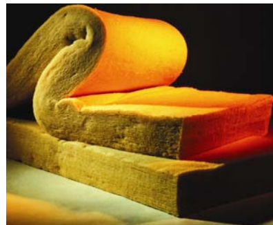
Vunasti materijal prije ugradnje

Vunasti su materijali dobar toplinski izolator ljeti jer su suhi i paropropusni. Prostor građevine koji je odgovarajuće toplinski izoliran i bez visoke vlažnosti pogodan je za bora-