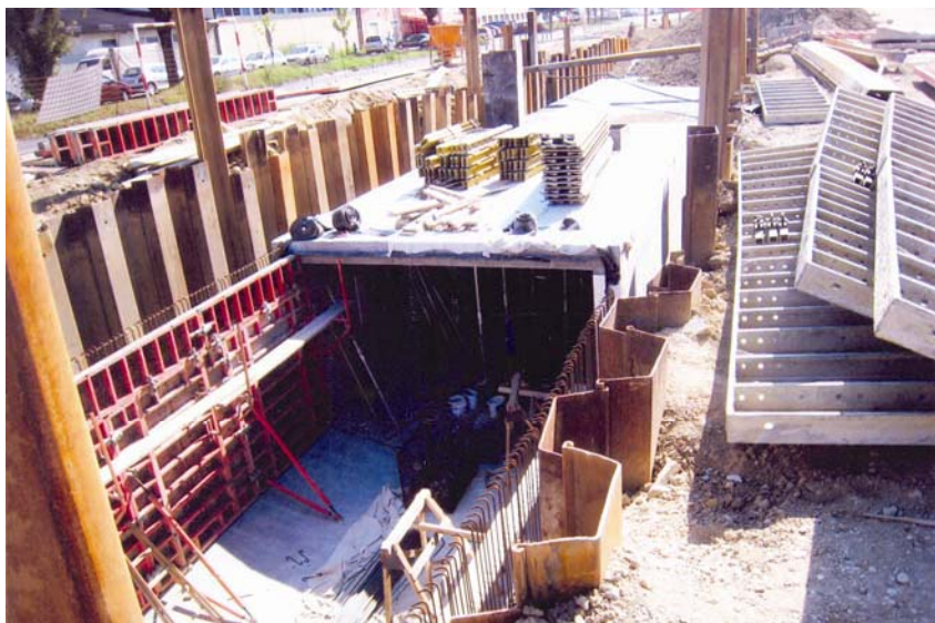
Građevna jama s izvedenim zakrivljenim dnom kolektora i buduće revizijsko okno

kom tri godine studiranja nemaju ni sata praktičnog rada. Tome nije potreban poseban komentar, ali kako će gradnja novoga kolektora potrajati, ne bi bilo na odmet da oni koji to mogu, ponajprije studenti iz Zagreba, obiđu ovo gradilište gdje imaju što vidjeti i naučiti. Možda bi to po