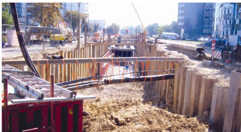
Građevna jama i dio izvedenog kolektora uz Radničku cestu