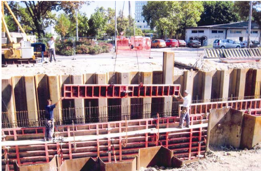
Pripremljena armatura i postavljanje unutrašnje i vanjske optlate

Namjerno ovdje ne navodim nikakve podatke o tvrtkama i ljudima jer se ne radi o reklamnoj poruci čitateljima, već samo o usporedbi kako se nekad radilo, a kako se sličan ili isti posao radi danas. Vjerujem da će najmlađim kolegicama i kolegama ovakav "vremeplov" biti vrlo zanimljiv, posebno i stoga što smo doznali da nove generacije studenata građevinarstva, barem one školovane prema „bolonjskom procesu“, tije