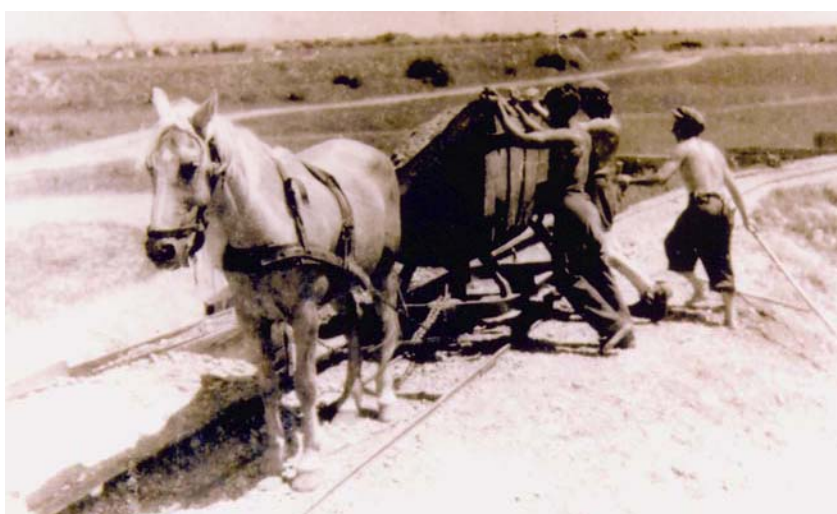
Višak se iskopa odvozi konjskim zapregama u depresije ili panirke

Kad je 1892. godine započela sustavna izgradnja kanalizacijske mreže u Zagrebu, među prvima se počeo graditi i veliki kolektor kroz Radničku cestu. Na temelju slika iz Muzeja grada Zagreba moguće je prikazati radove na tom kanalu paraboličnog profila 480/330 cm (nizvodno čak i 550/350 cm). Kako je Sava tada tekla kroz brojne rukavce Savišća (kao što su Savica i sl.), razina je podzemne vode bila prilično visoka i stoga ju je trebalo crpiti iz građevne jame. To se radilo crpkama kojima su pogon