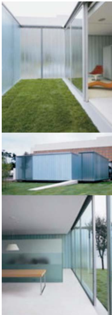
Dijelovi pametne kuće iz Porta