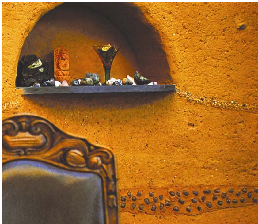
Dio zemljanog zida

Kuća građena na tradicijski način sa zemljanim zidovima debljine od pola metra ili više (nepečeni materijal) i stropovima od drvenih greda te zemljanom ispunom, zadovoljava i ljetni i zimski temperaturni režim uz udobno stanovanje i uštedu energije.