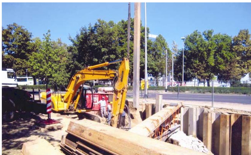
Suvremeni iskop kanalizacijskog rova uz zabijenu metalnu oplatu koja štiti redovit promet Ulicom grada Vukovara

Tako iskopan rov potom se dotjera na nužnu širinu i uzdužni pad, a onda se dno betonira s poprečnim padom, slično kako je to bilo i u postojećem kolektoru. Nakon toga se slaže mreža dvostruke armature i