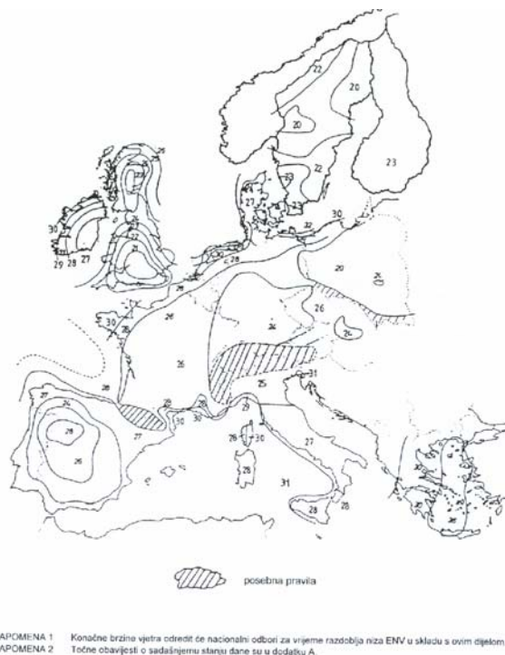
Slika 2. Europska karta vjetra - ENV

Osnovne usporedne brzine vjetra, definirane kao 10-minutne srednje brzine na visini od 10m iznad ravnog tla kategorije hrapavosti II koje se mogu očekivati za povratni period od 50 godina, uglavnom su bitno previsoko određene (usporedba - susjedne jadranske zemlje – slika 2.).