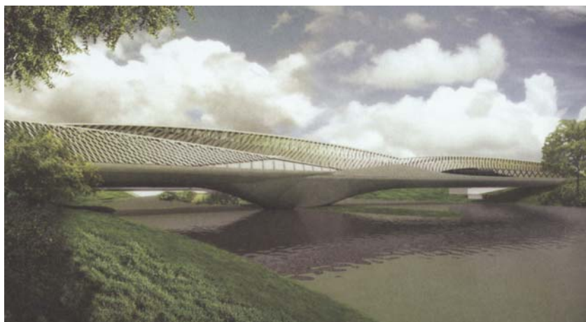
Paviljon – most preko rijeke Ebro

Kasnije su izvođači Dragados S.A. i Urssa predložili alternativno kons-