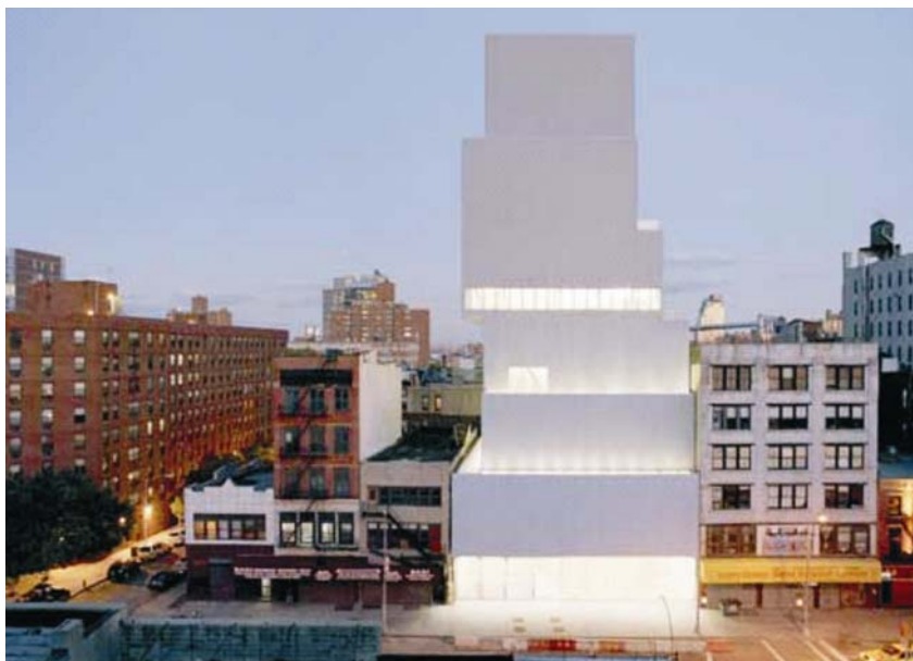
Interpolacija novoga Muzeja suvremene umjetnosti

lje presvučeno je aluminijskom mrežom. Pažljivo izveden stakleni pojas