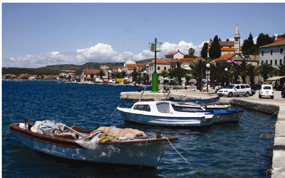
Pogled na dio obale Rogoznice

Što se tiče ukupne realizacije Projekta Jadran , trenutno se u prvoj fazi projekta 80 posto građevina ugovara, a 90 posto ugovorenih poslova