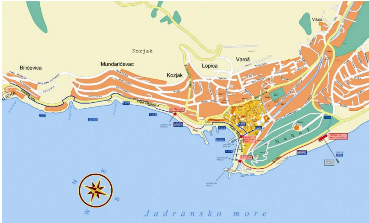
Shema kanalizacijskog sustava Senja

no pred više od 3000 godina na brdu Kuk, istočno od današnjega smještaja grada, a vjeruje se da se već u prapovijesno vrijeme ispod utvrđenog naselja, na utoku bujice u dugi zaljev, nalazilo sidrište i trgovište na koje-