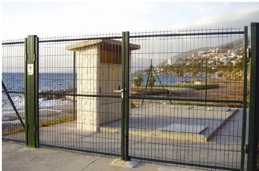
Ulaz u crpnu postaju Škver