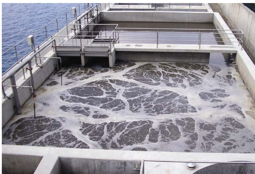
Aeracijski bazen u punom pogonu

Za sušnoga razdoblja na uređaj dolazi 550 m 3 vode, a tijekom kišnoga razdoblja te se vrijednosti učestvostručuju. KPK se vrijednost u ulaznoj vodi kreće od 300-400 mg/l, a u izlaznoj vodi iznosi 20-30 mg/l. BPK 5 vrijednost ulazne vode kreće se od 150-200 mg/l, a u izlaznoj vodi iznosi 5-7 mg/l. Također se dnevno