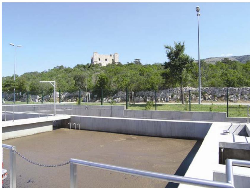
Aeracijski bazen s tvrđavom Nehaj u pozadini

količinu viška mulja od 650 kg na dan. Višak se mulja izdvaja iz cjevovoda povratnog mulja s oko 7 kg/m 3 , a izdvojeni se višak mulja izravno odvodi na postrojenje za njegovu dehidraciju.