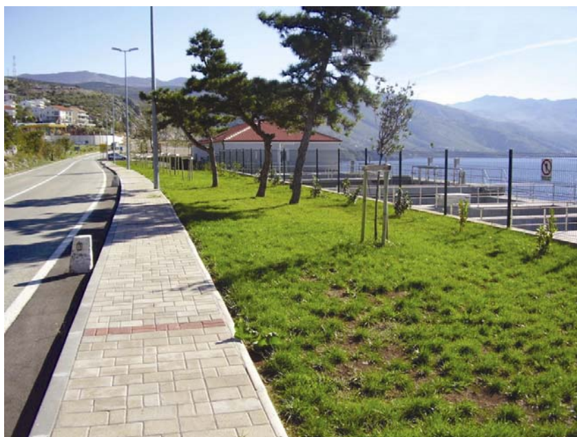
Tlačni cjevovod do biološkog uređaja za pročišćavanje

Interni je laboratorij smješten u sklopu uređaja i opremljen za potrebe dnevnih analiza izlazne kvalitete vode i pojedinih stupnjeva pročišćavanja. Analiza obuhvaća dnevni protok vode kroz uređaj za pročišćavanje, temperaturu vode, pH izlazne vode,