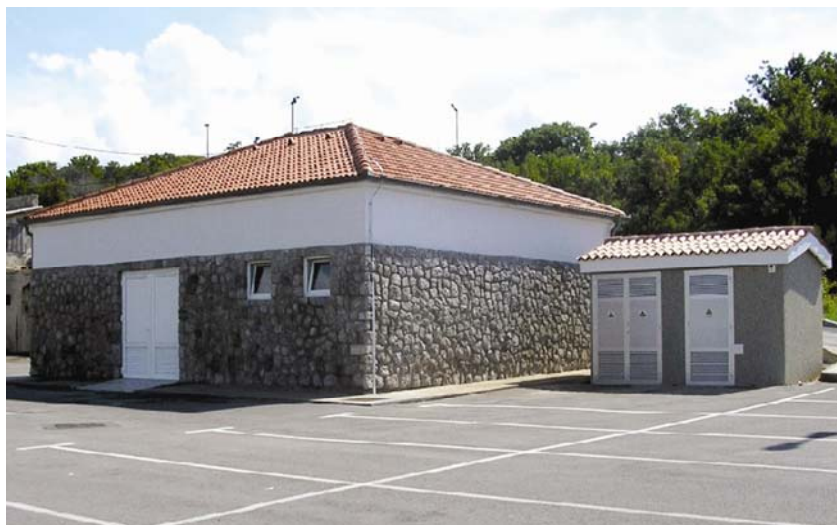
Izgrađena crpna postaja Điga

Mehaničko pročišćavanje se nastavlja u pjeskolovu koji je izveden kao kružna građevina (bazen) promjera 4 metra gdje se taloženjem izdvajaju