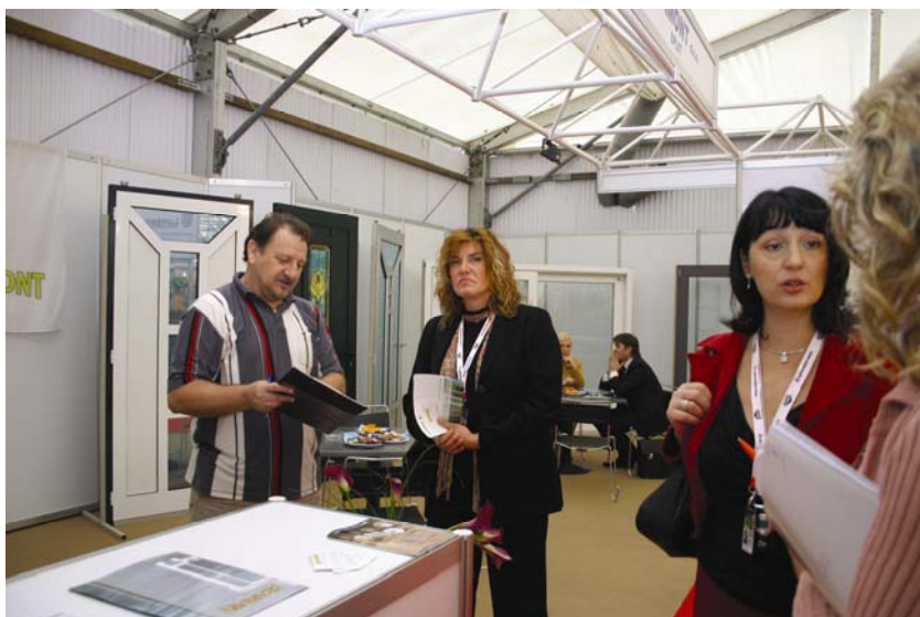
Detalj sa sajma

održan i okrugli stol o važnosti poduzetničkih zona u Hrvatskoj. U raspravi su sudjelovali predstavnici nadležnog ministarstva, odgovarajućih hrvatskih i međunarodnih udruženja za poticanje poduzetništva te župani Lučke-senjske, Zadarske, Šibensko-kninske, Dubrovačko-neretvanske i Splitsko-dalmatinske županije. Ocijenjeno je da poduzetničke zone potiču proizvodnju, izvoz, povećavaju dotok stranog kapitala, slobodnju i jeftiniju otpremu i transfer