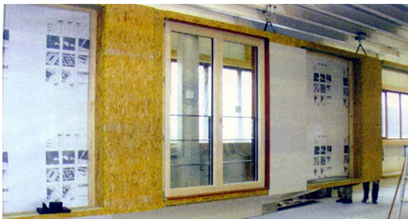
Ugrađivanje dodatne toplinske izolacije

Istodobno je smanjen udio drva u građevnim elementima od laganog drveta na 6 do 9 posto. Ta odluka o većoj kvaliteti nije donesena iz gospodarskih razloga, jer su dodatni troškovi za pročelja visoki, nego je to odlučio investitor koji vjeruje da takve zgrade imaju veliku budućnost.