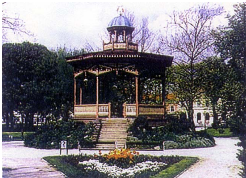
Gradski park u Koprivnici na mjestu negdašnje utvrde

Koprivnica je ime dobila po istoimenoj rječici koja protječe južno od grada, a spominje se u ispravama kralja Andrije II. Arpadovića u nekoliko navrata početkom 13. st. Naselje se prvi put spominje u darovnici desetogodišnjeg kraljevića Ladislava IV. Kumanca (Posmrčeta) kaštelanu i vitezu koprivničke utvrde Bakaleru. To je ujedno i prvi spomen posebne koprivničke utvrde – kaštela. Utvrda će se poslije češće spominjati tijekom gradnje velike protutur-