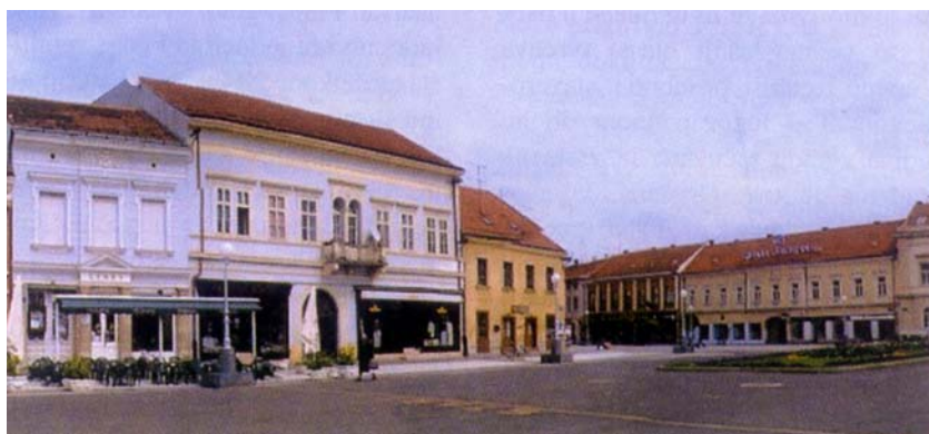
Zgrade na središnjem trgu u Koprivnici građene na rubu negdašnje utvrde

Uz gradnju ove utvrde vezano je nekoliko zanimljivosti. Iako je bila svrstana među državne prioritete, nije građena kako je bilo planirano s pet bastiona, već je, valjda da se sačuva postojeći stari kaštel, izgrađena s četiri bastiona kao nepravilan i deformirani četverokut, a bastion je oko kaštela i posljednji izgrađen. Najvjerojatnije je to učinjeno u vrijeme kad je radove nadzirao J. Vintano. Također se iz mnogih izvještaja brojnih povjerenstava koja su obilazila to veliko gradilište može uočiti da radovi nisu baš najbolje izvedeni i da je voda često oštećivala drvom ojačane zemljane bastione te da su se često slijegali iako su temeljeni na drvenim pilotima. Druga je značajka bila u bočnim bastionskim stranicama. One su kod talijanskih graditelja uvijek uvučene, valjda stoga što su ih pretežno gradili u kamenu, a kod nizozemskih graditelja tvrđava, koji su se specijalizirali za čiste zemljane utvrde, bočne su stranice uvijek izravnane. Zanimljivo jest da je koprivnička utvrda u početku prema nacrtima imala uvučene bočne strane bastiona, a da se te strane u kasnijim crtežima sve više izravnavaju. Vjerojatno je to učinjeno pod utjecajem nizozemskih iskustava, a zna se da su Pasqualini i Wendeschitz na gradilište stigli iz Nizozemske, gdje su bili na usavršavanju. Vjerojatno je pod njihovim utjecajem uključen i predbedem koji se vidi na Stierovu crtežu, a koji nije