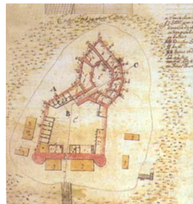
Tlocrt utvrde u Đurđevcu s kraja 18. st.

taavlja vojničku posadu. Stanje utvrde je čini se loše, a povjerenstva koja obilaze isturene utvrde često zahtijevaju da se utvrda u Prodaviću popravi. Čak zbog njezine velike strateške važnosti nerijetko predlažu da se utvrda u Đurđevcu poruši, a u Prodaviću izgradi jedna velika suvremena tvrđava, poput onih u Karlovcu, Križevcima, Ivaniću ili u obližnjoj Ko-