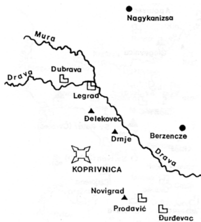
Prikaz utvrda Koprivničke kapetanije iz 1577.

ske bastionske tvrđave, no čini se da je bila u cijelosti od drva. Valja još dodati da su krajem 13. st. (1292.) u Koprivnicu na poziv bana Henrika Gisingovca došli franjevci koji su podigli samostan i župnu crkvu Blažene Djevice Marije.