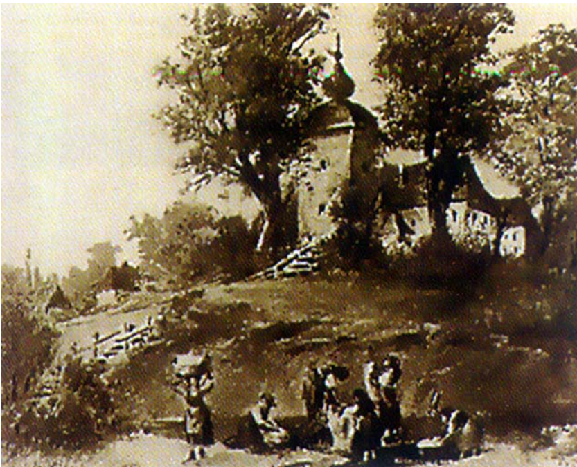
Crtež srednjovjekovne utvrde Rasinja

I Opoj i Rasinja promijenili su mnogo vlasnika. U 16. st. vlasnici su bili plemići Bočkaji (koji su držali i obližnju utvrdu Herbortya), potom Ljudevit Pekri i hrvatski ban Toma Erdödy. Nakon toga udajom su neko vrijeme vlasnici postali grofovi Auespergeri te po istom načelu grofovi Geiszruk. Od njih su Rasinju kupili Inkéyi i držali ga sve do 1945. godine. Oko Koprivnice zaista je bilo mnogo starih utvrda od kojih je također vrlo malo sačuvano. Tako su sjevernije, u predjelu između Drave i Koprivnice, postojale utvrde Đelekovec i Drinje. Đelekovec je bio i srednjovjekovna utvrda, ali je zbog turske opasnosti posebno utvrđen radi osiguranja prijelaza preko Drave, dok je Drinje utvrđeno samo kao zaštita od vrlo bliske granice s Otomanskim carstvom. No bilo je utvrda i južnije, na obroncima Bilogore.