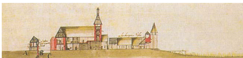
Prikaz đurđevačke utvrde s kraja 18. st.

Od toga je sačuvan samo dio sjevernog zida. Utvrda je imala i četverokutnu kulu visoku 12 m. Sasvim je sigurno da je oko utvrde bio poseban opkop.