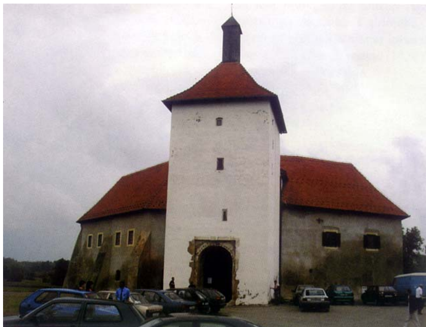
Ulaz u utvrdu

Đurđevac je zajedno s ostalim posjedima u Podravini dobio ban Mikac, a on je vjerojatno na mjestu sadašnje izgradio utvrdu Sušicu kao sklonište za stanovnike naselja. Đurđevac je u naslijeđe dobio njegov sine Stjepan Prođavić, a on je bio toliko nasilan čovjek da su ga suvremenici čak nazivali "vragom". U dinastičkim borbama između Ladislava Napuljskog i Sigismunda Luksemburškog bio je otimač i pljačkaš. No priklonio se banu Stjepanu Lackoviću koji je skupa s još 32 stradao na "Krvavom