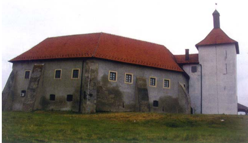
Pogled na utvrdu u Đurđevcu sa sjevera

spominju 14. a neki 15. st., što dokazuju pločom pronađenom u utvrdi. Iako se u spisima utvrda prvi put spominje 1408., kada je već nemirnom i pustolovnom Stjepanu Prođaviću Đurđevac bio oduzet, neki tvrde da ga je upravo on gradio. To obrazlažu sličnošću s našim najbolje očuvanim "vasserburgom" Ribnikom blizu Kupe, kojega je Stjepan također bio vlasnik. Dvojbe oko nastanka sadašnjega Staroga grada izazva-