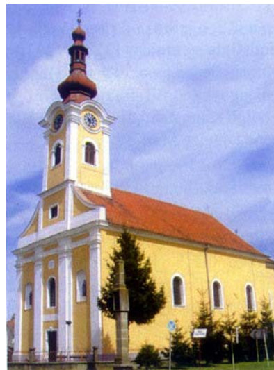
Crkva Rastanka sv. Apostola u Novigradu Podravskom

Na ulazu u Javorovac, selu otprilike 14 km jugoistočno od Koprivnice, pokraj ceste s kojom se ide prema Novigradu Podravskom, pronađeni su ostaci utvrde koju je narod nekad nazivao Poljan grad. Prema ostacima jarka utvrdu je locirao kupac zemljišta početkom 20. st., a najstariji su mu suseljani ispričali da je tu nekad bio kružni šanac s humkom u sredini. Sjetili su se također da se davno veći dio šanca urušio u rječicu Komarnicu. Vlasnik je u jarak navozio zemlju da bi zemljište mogao obrađivati. No pri oranju pronašao je mnoge ostatke raznovrsnog posuđa, a i mnogo "šodera" uz rub oranice gdje se, kako je pretpostavljao, nalazila stara rimska cesta.