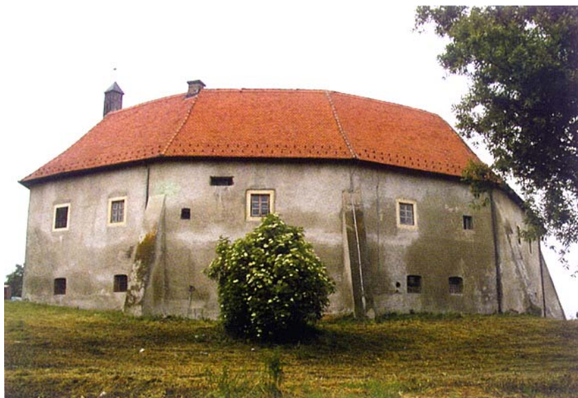
Pogled na utvrdu u Ćurđevcu s juga

ne su postojanjem starog kaštela, za koji nije sigurno da se nalazio na istome mjestu. To bi mogla razriješiti arheološka istraživanja koja nikad nisu provedena do kraja. Ipak sasvim je sigurno da je utvrda građena kao zamak i sjedište feudalnog posjeda. A uklesana godina 1488. na kamenoj ploči mogla bi značiti vrijeme kada je Stari grad dobio svoj konačni izgled, koji se nije bitno promijenio do današnjih dana.