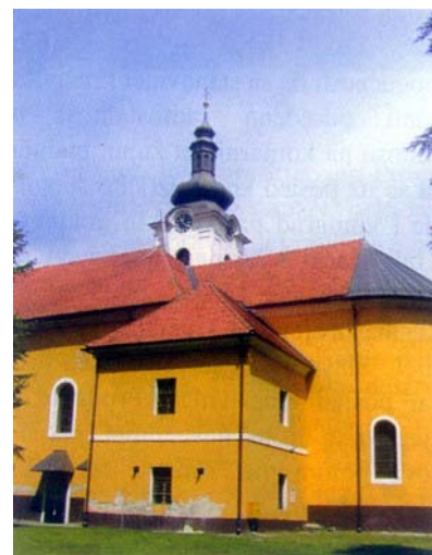
Crkva sv. Martina u Virju

Odmah do Novigrada nalazi se Virje, smješteno u srednjem toku rječice Zdele, a ono se do 17. st. nazivalo Prođavić. No rijetko su koje ime mjesta kraljevski i kaptolski pisari tako često mijenjali kao što je to bio slučaj s Prođavićem. Najčešće su mijenjali prvi samoglasnik. Tako se najprije pisalo Predeuych, zatim Pradauiz pa Prođawiz. No čini se da se zabune s tim nazivom nastavljaju i danas, jer se primjerice u Hrvatskom leksikonu zove Prođanić, a povjesničarka Agneza Szabo piše Podravić.