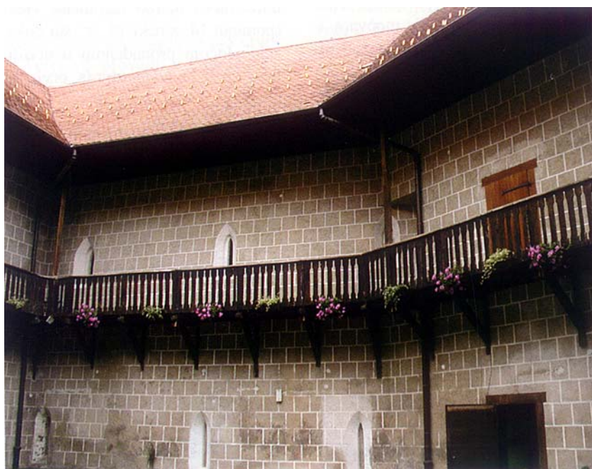
Detalj dvorišta utvrde u Ćurđevcu

Tako se u dugom životu Ćurđevačke utvrde mogu pratiti tri različite povijesne i graditeljske faze. U prvoj je fazi bio središte velikoga plemićkog