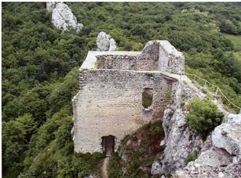
Četvrtasta kula i strmi uski prilaz

Uz boravak Bele IV. u Velikom Kalniku još i sad postoji živa legenda koju je u pjesmu pretočio August Šenoa. To je legenda o plemićima –