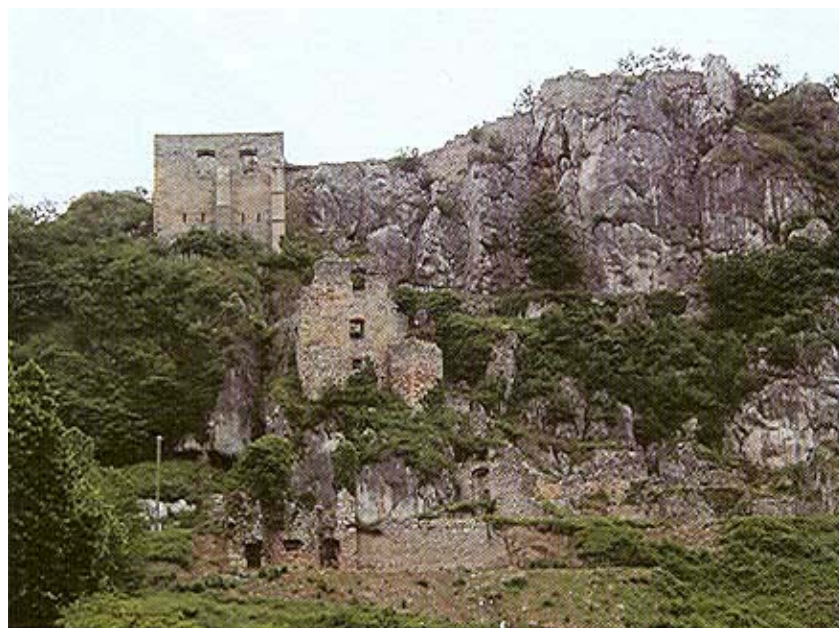
Pogled na ostatke Velikog Kalnika

nom. Ivan Kukuljević Sakcinski, koji ju je mnogo proučavao, ustvrdio je da je gornji dio znatno stariji, a donji, koji je urušeniji, mlađi. Čak je vjerovao da gornji dijelovi potječu iz rimskih vremena. I on je poput mnogih drugih držao da je ta utvrda izgrađena u vrijeme narodnih vladara, ali istraživanja to nisu potvrdila. Gotovo je sigurno da je neka utvrda na istom mjestu i prije postojala, baš