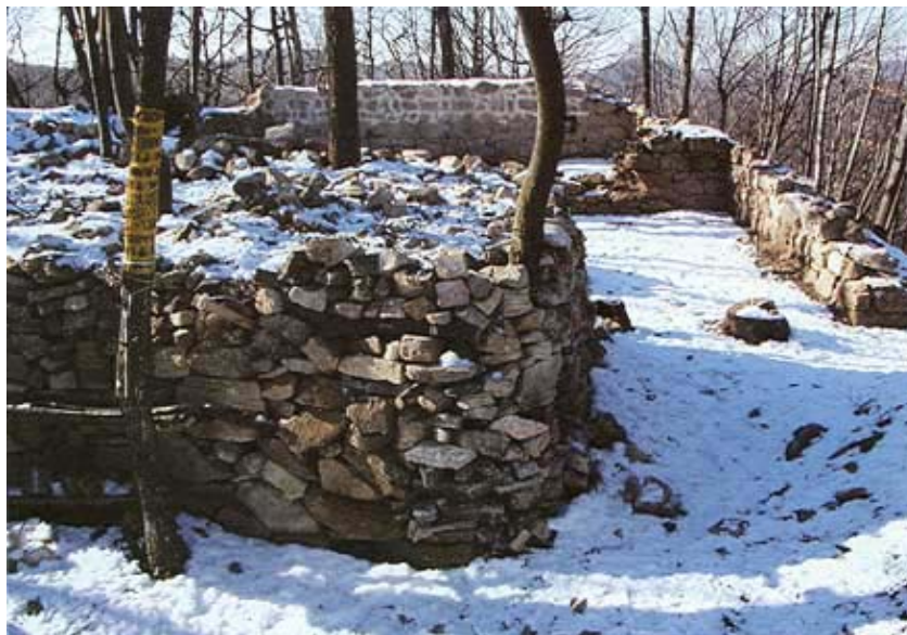
Ostaci utvrde Čanjevo

No ono što posebno veseli jest planinarski dom u blizini koji je tridesetih godina prošlog stoljeća izgradio poznati arhitekt Stjepan Planić, a čak je sudjelovao i u njegovoj obnovi nakon Drugoga svjetskog rata u kojemu je stradao od požara. Dom se izuzetno dobro uklopio u okoliš i