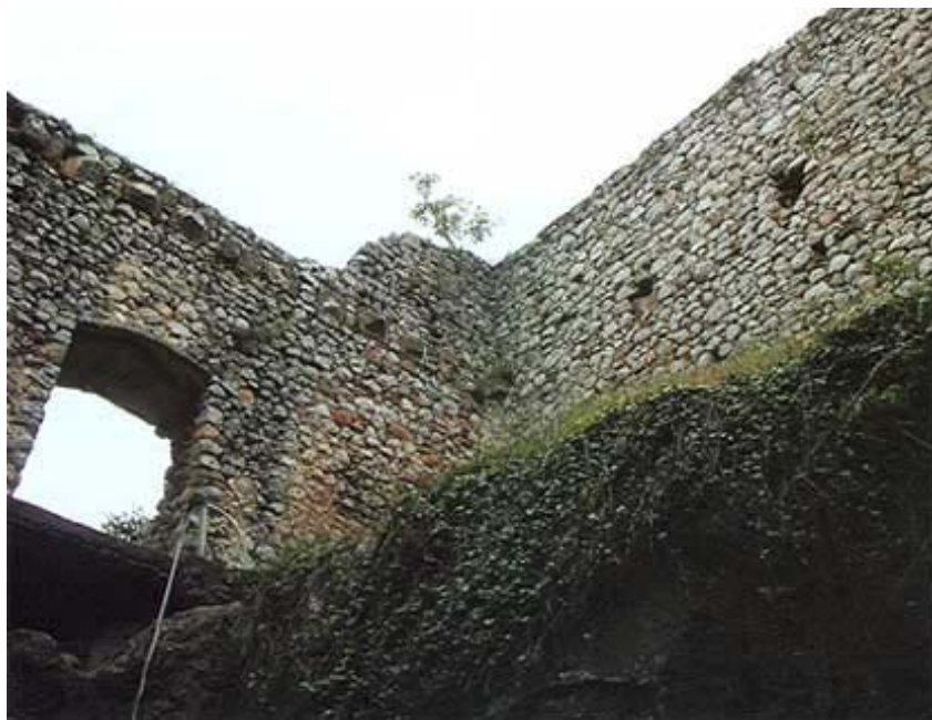
Ostaci stambenog dijela Velikog Kalnika

Najviši je dio utvrde mali poligon izgrađen na uskoj stijeni koju su, kako je utvrdio Szabo, graditelji premostili drvenim gredama. No zidovi su gotovo potpuno nestali. Gotovo je sigurno u blizini bila i kapelica, a u predaji je još sačuvano sjećanje da je kapelica bila posvećena sv. Katarini. Taj najviši dio povezan je uskim hodnikom s glavnom zgradom. Hodnik je možda nekad bio veza i s višim katovima kojih danas više nema. No sasvim je sigurno da je ta zgrada, zapravo četvrtasta kula, bila glavni smještajni prostor. Izuzetno je čvrsto građena što je i danas sasvim uočljivi