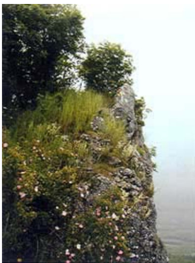
Strma stijena na kojoj se nalazi Mali Kalnik

hrvatska operna pjevačica i pjevala je ulogu Ljubice u prvoj hrvatskoj operi Ljubav i zloba Vatroslava Lisinskog. Prva je na koncertu u Zagrebu 1835. otpjevala slavnu budnicu Još Hrvatska nij' propala Ferde Livadića. Na svečanom zastoru Hrvatskoga narodnog kazališta slikara Vlahu Bukovca, Sidonija Erdödy Rubido nalazi se s ostalim slavnim ilircima u društvu Ivana Kukuljevića Sakcinskog.