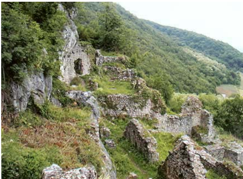
Unutrašnjost četvrtaste kule

obližnji zavidni Križevčani, ali su i sami sebe tako nazivali jer su bili seoski plemići ili plemići s jednog selišta, tzv. jednoselišni plemići. Najviše ih ima u okolici Malog Kalnika gdje su u posljednje vrijeme njihovi potomci utemeljili i posebnu udruhu.