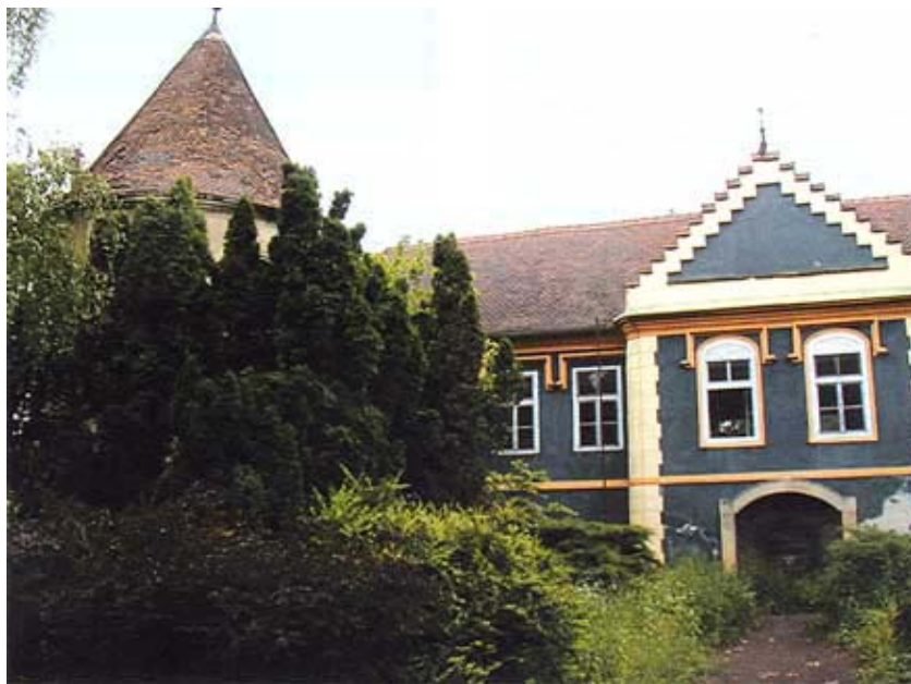
Dvorac u Gornjoj Rijeci