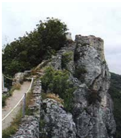
Najviši i najstariji dio utvrde

stoljeća i kralj Matija Korvin. Potvrđivali su je Vladislav II. Jagelović (1492.), Ludovik II. Jagelović (1526.), Matija II. Habsburgovac (1612.) itd. Tim su povlasticama kalnički plemenitaši, smješteni na području od naselja Kalnik na istoku do Visokog (prema legendi iz tog su sela nosili grane sa šljivama) na zapadu i Zaistovca na jugu, a radi se o dvadeset plemenitih sela te nekoliko naselja na sjevernim obroncima Kalničke gore, bili oslobođeni svih feudalnih daća (tlake, devetine, zalaznine i crkvene desetine). To im je pružalo znatno veću sigurnost nego što su je imali obični kmetovi.