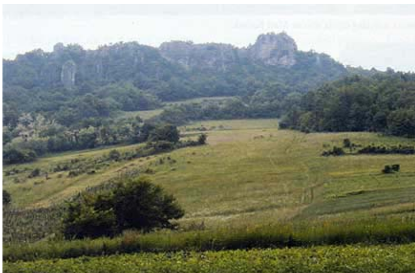
Pogled na stijenu i ostatke Malog Kalnika

Inače je dvorac u Gornjoj Rijeci u koji se preselila uprava vlastelinstva