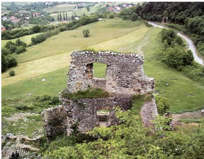
Ostaci ulazne građevine

ma povratilo snagu, a šljive su od gladi spasile i kralja. Zauzvrat je Bela IV. svim seljacima oko Kalnika dodijelio titulu plemića. Ta je legenda vrlo živa, ali ima i mnogo povijesnih podataka koje joj ne protuslove. Činjenica je da su posebne povlastice Kalničanima potvrđivali mnogi kraljevi i banovi. Ime je možda posprdnno, vjerojatno su im ga nadjenuli