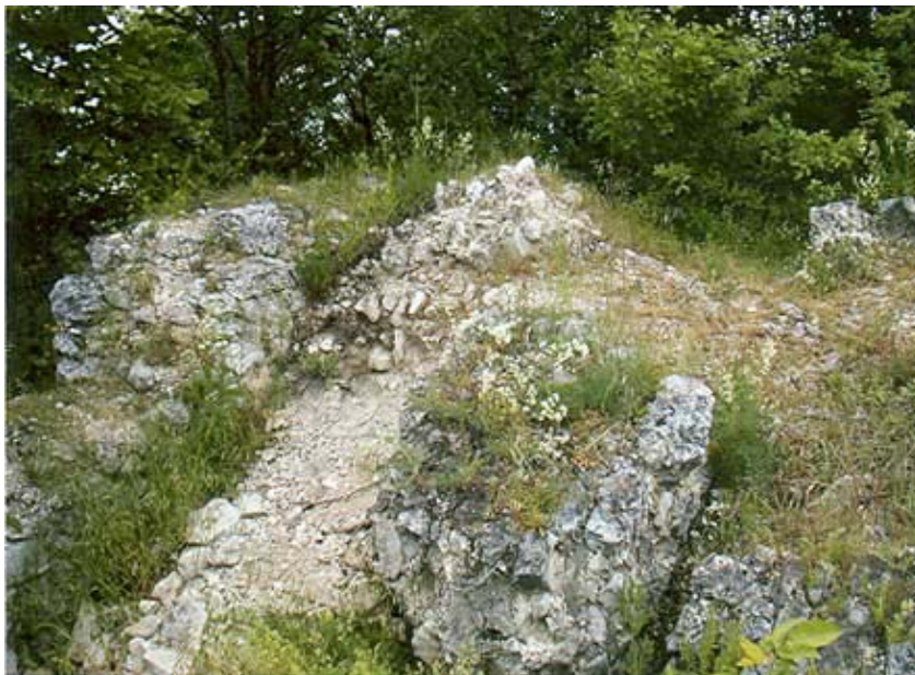
Ostaci najvišeg dijela utvrde Mali Kalnik