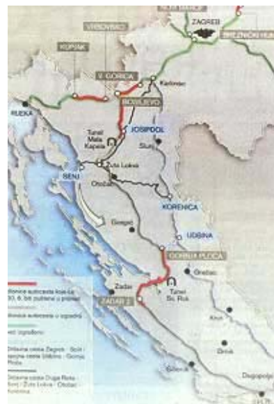
Prometne varijante za ljeto 2003.

Do pune turističke sezone bit će izgrađeno 108 km novih autocesta. Prema zadanim rokovima, upravo bi 30. lipnja za promet trebali biti otvoreni pravci Vukova Gorica – čvor Bosiljevo 2, Bosiljevo – Josipdol (27,1 km), Josipdol – Mala Kapela (8,5 km), čvor Gornja Ploča – tunel Sveti Rok – Maslenički most – čvor Zadar 2 (55 km) i Breznički Hum – Novi Marof (9,6 km). Ujedno bi trebala biti gotovo i spojna cesta Udbina – Gornja Ploča (21 km). Nakon otvaranja tih dionica najviše će profitirati putnici prema Zadru, dok će putnici prema Splitu najvjerojatnije i dalje putovati