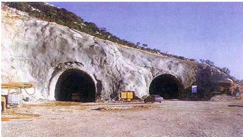
Tunel Brezik na dionici Sv. Rok - Maslenica

tuneli, s tim da su neki, poput Svetog Roka, već prije probijeni, iako predstoji proboj druge cijevi. Na spomenutom otvaranju radova na tunelu Vrtlinovec najavljeno je 22. studenoga otvaranje radova na tunelu